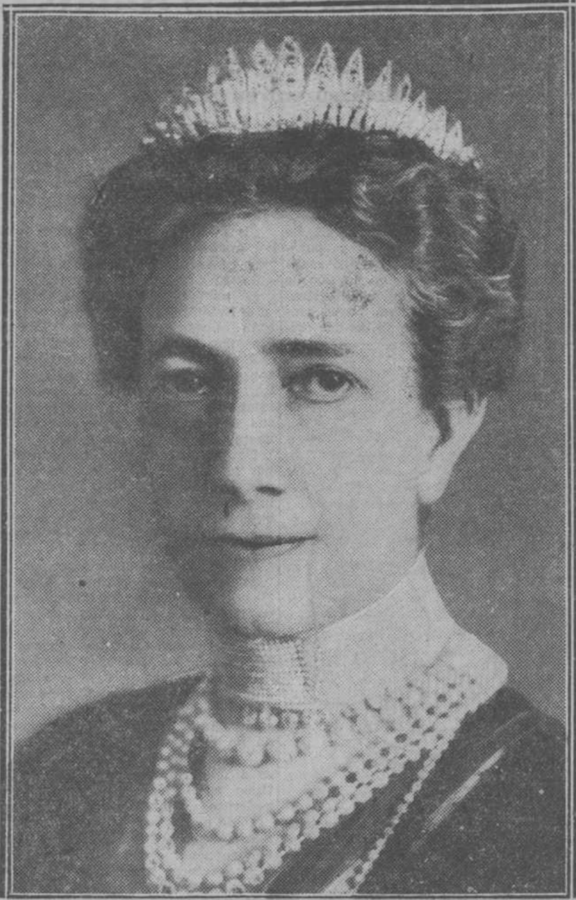
La reina Victoria de Suecia, que se halla enferma de gravedad

La augusta señora reside en la capital de Italia desde hace tiempo. Su salud venía inspirando inquietudes, que ahora, por desgracia, parecen acentuarse. El rey Gustavo salió hace días para Roma, y se halla al lado de la enferma. La reina Victoria nació el 7 de agosto de 1862, y cuenta, por tanto, en la actualidad sesenta y seis años. Nació princesa de Baden y se casó en 1881, en Calshruhe.