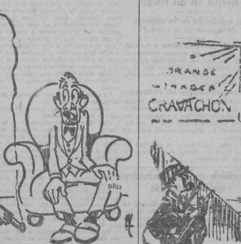
PRECAUCION —No te quejarás, papá. He disparado lo más dulcemente posible mientras tú dormías.