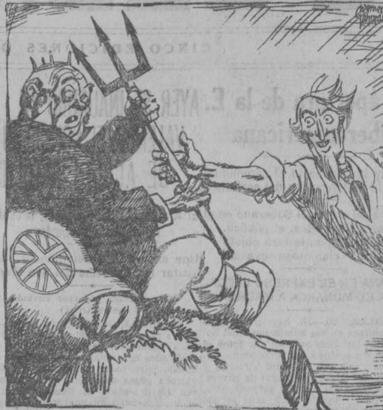
EL TIO SAM.— Padre, dame el tridente, que se ha hecho demasiado pesado para tu brazo.