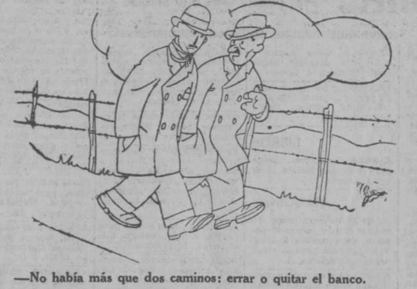
—No había más que dos caminos: errar o quitar el banco.