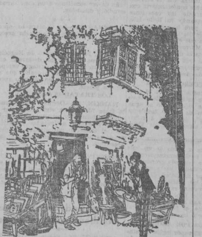
LA SEÑORA.—Aquel cuadro de Rubens que tiene marcado el precio de trece pesetas, ¿es auténtico o es una copia? ("The Passing Show", Londres.)