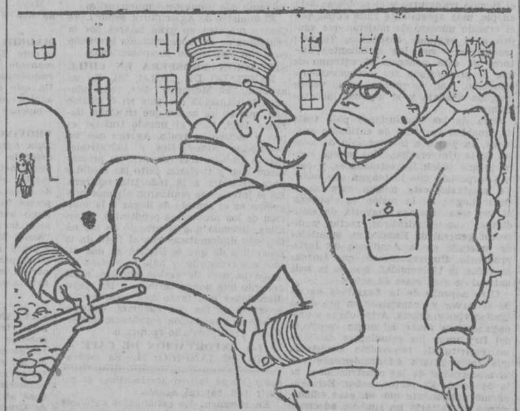
—¿Sabe usted leer y escribir? —Escribir solamente, mi coronel. ("Le Rire", París.)