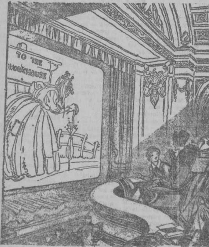
BILLY (al ver llorar a su madre).—No llores, mamá. Cuando tú seas vieja yo no consentiré que vayas al asilo de ese modo. LA MADRE.—¿Qué harás tú, hijo mío? BILLY.—Te acompañaré yo mismo en un "taxi". ("London Opinion", Londres.)

En el teatro no molestarán con tu arte al auditorio y artistas si tomas PASTILLAS CRESPO. En América y Filipinas el medicamento español más conocido son las PASTILLAS CRESPO para la tos. Te hará invulnerable a la gripe, pulmonía y catarros antiseptizando tus vías respiratorias con PASTILLAS CRESPO.