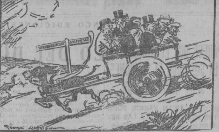
Stanley: Me es grato decirlos, señores, que hemos vuelto la espalda a los gastos excesivos ("John Bull", Londres.)