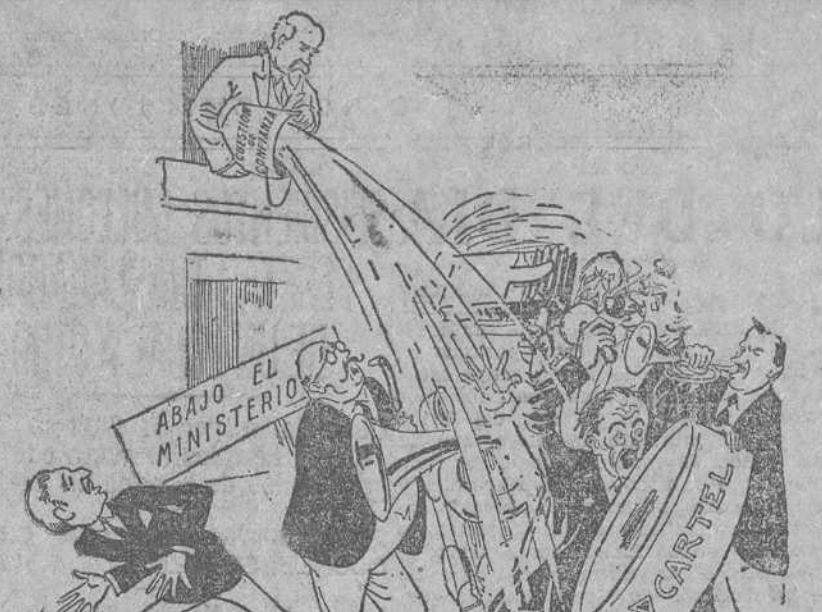
POINCARÉ.—Basta! Con la música a otra parte!