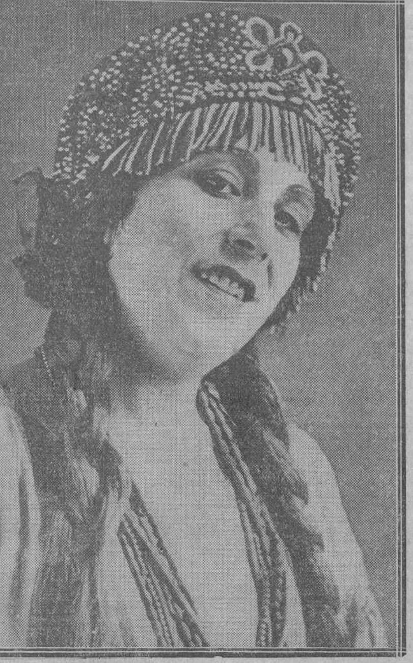
La cantante española Lucrecia Bori, a quien se ha concedido la cruz de Alfonso XII por la función de beneficencia en Nueva York a favor de la Ciudad Universitaria

Más de trescientas mil pesetas de beneficio dió para la Ciudad Universitaria española la función de gala celebrada días pasados en el "Metropolitan Opera House", de Nueva York. De esta cantidad, una parte importante corresponde a la ilustre artista española, hoy recompensada por su generoso rasgo.