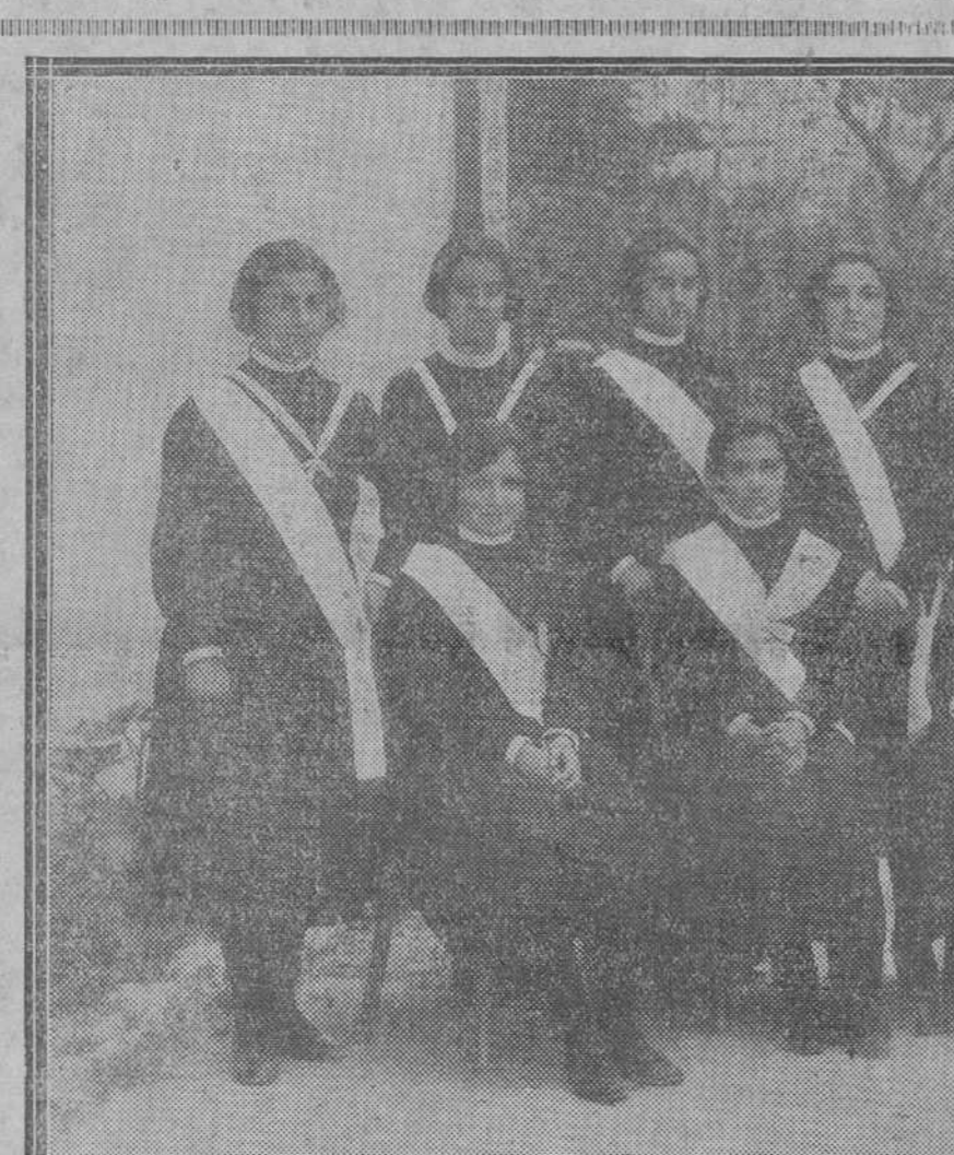
La infanta Isabel Alfonsa y sus compañeras del Colegio de las Madres Irlandesas de Madrid