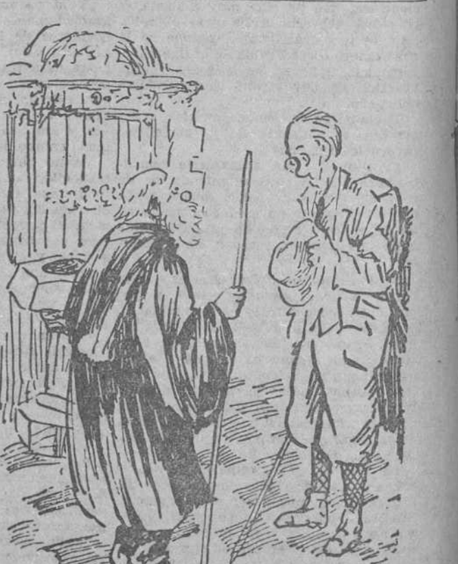
EL VERANEANTE NUEVO.—Me han dicho que éste es un buen sitio para el reuma. EL VERANEANTE VIEJO.—Sí, señor, sí. Aquí pesqué yo el mío. ("Judge", Nueva York).