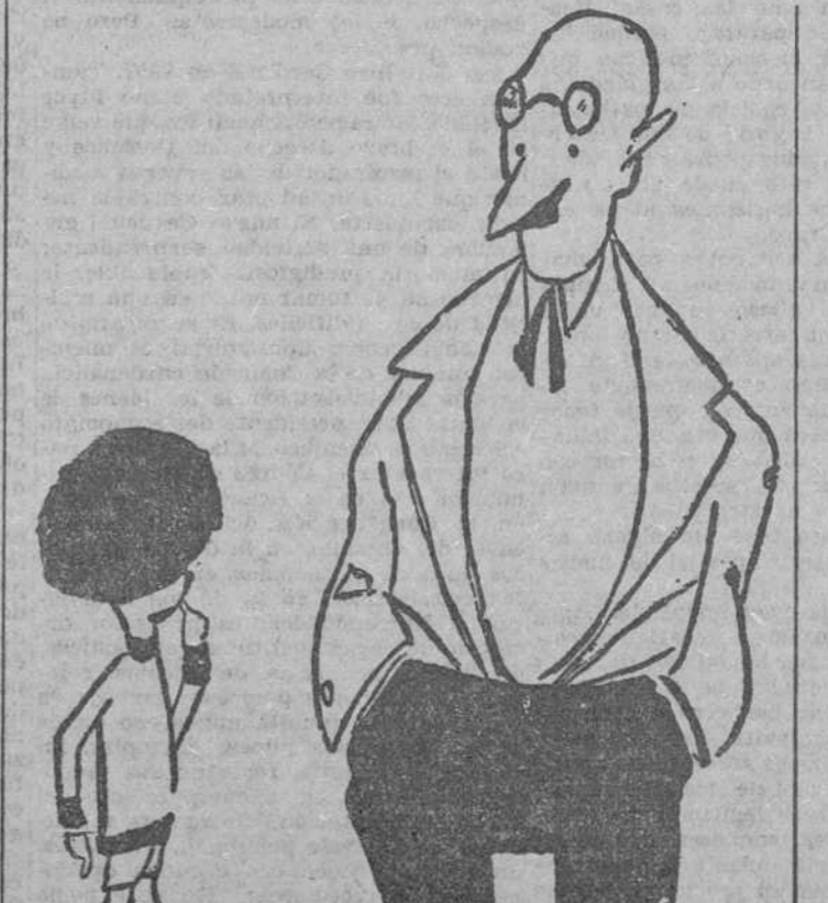
¿Por qué no aprendiste la lección de Mitología que te señalé? —Porque mi papá me ha prohibido decir mentiras. ("Le Rire", París).