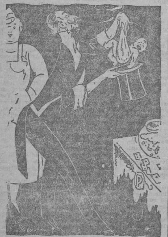
LA COSTUMBRE. El famoso prestidigitador es padre por vez primera..