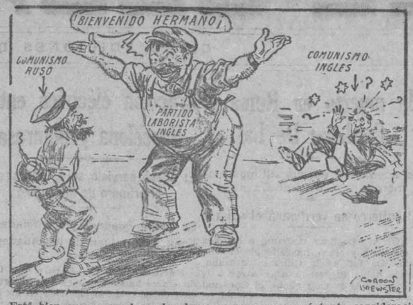
Está bien que se expulse a los de casa; pero ¿por qué tanta consideración a los de fuera? ("Dublin Herald").