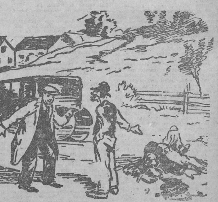
—¿Hace usted el favor de ir corriendo a avisar al médico del pueblo? —Es el atropellado, y no hay otro. ("Le Rire", París.)