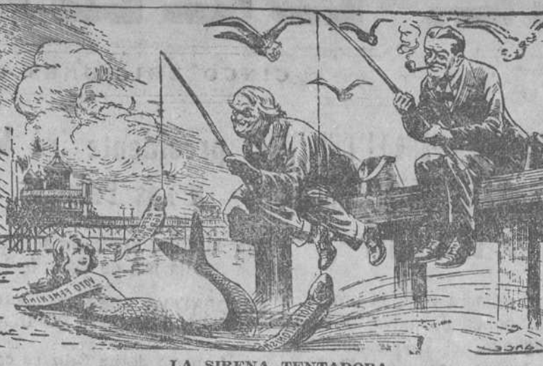
LA SIRENA TENTADORA ("John Blunt", Londres.)