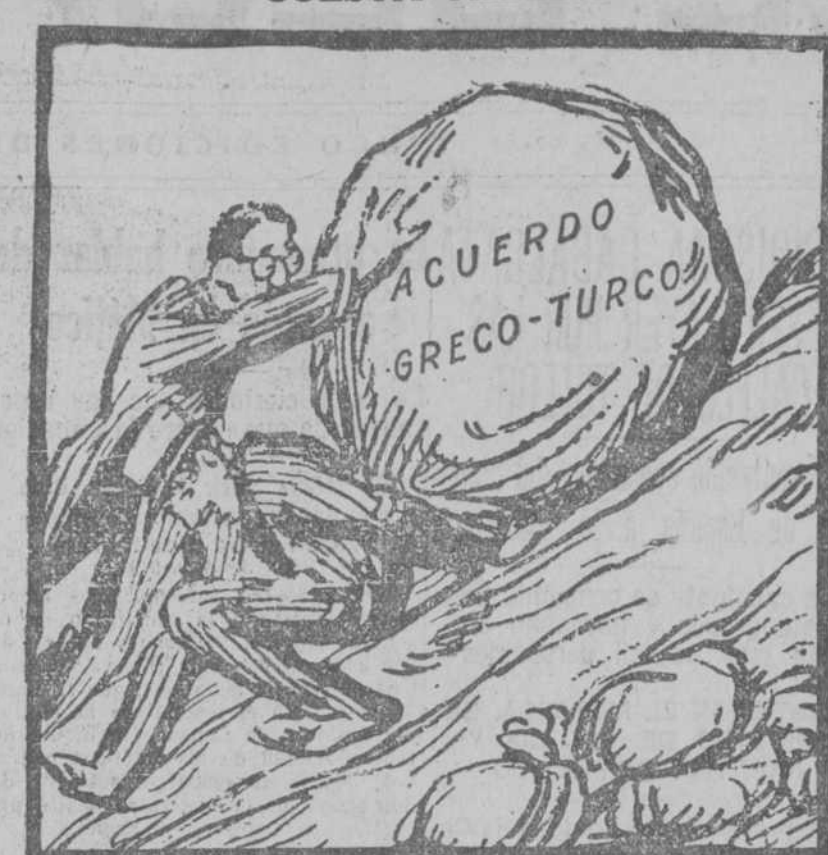
DE TODOS MODOS, LA BUENA VOLUNTAD NO FALTA, Y MAS VALE TARDE QUE NUNCA.