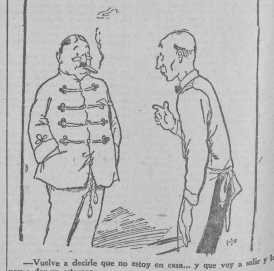
—Vuelve a decirle que no estoy en casa... y que voy a salir y le voy a dar un estacazo.