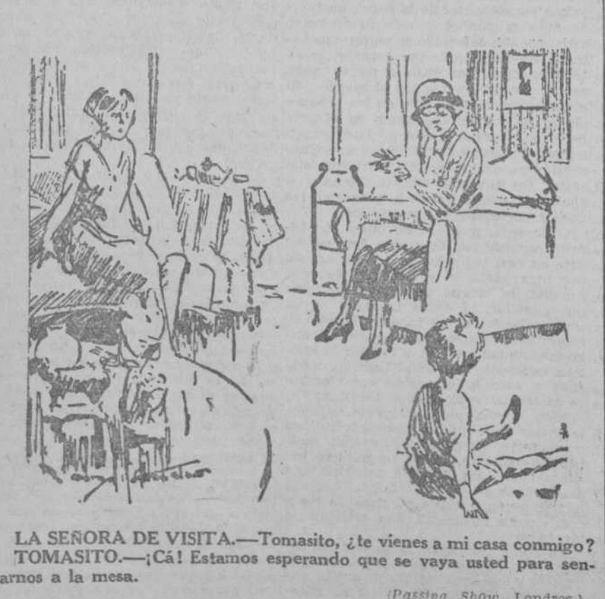
LA SEÑORA DE VISITA.—Tomasito, ¿te vienes a mi casa conmigo? TOMASITO.—¡Cá! Estamos esperando que se vaya usted para sentarnos a la mesa.