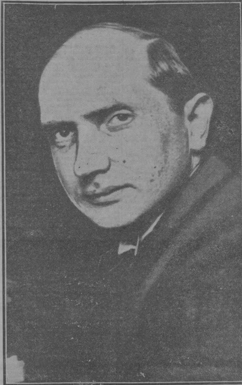
Augusto Zaleski, ministro de Negocios Extranjeros de Polonia, que se halla en Italia para conferenciar con Mussolini

Seis millones para nuevas repoblaciones forestales en Pontevedra. Se autoriza la vía Madrid-Valencia. El reglamento para la venta de drogas tóxicas, aprobado.