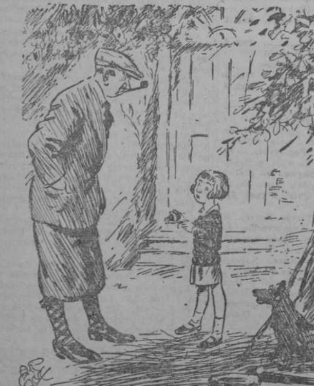
EL TIO (que ha regalado a su sobrina un huevo de Pascua).—Nena, parece que has quedado desilusionada.—¿Si, es que yo creía que los huevos se vendían hacer ahora? por docenas.