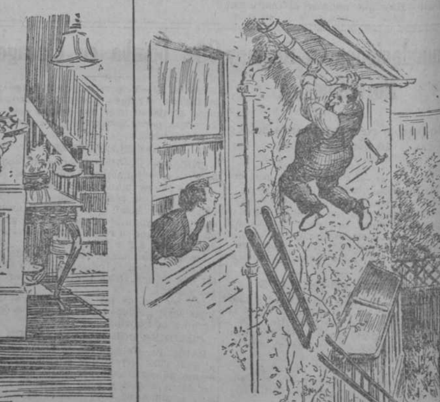
—¡Crispulo, hijo! ¡Te has salvado por casualidad!