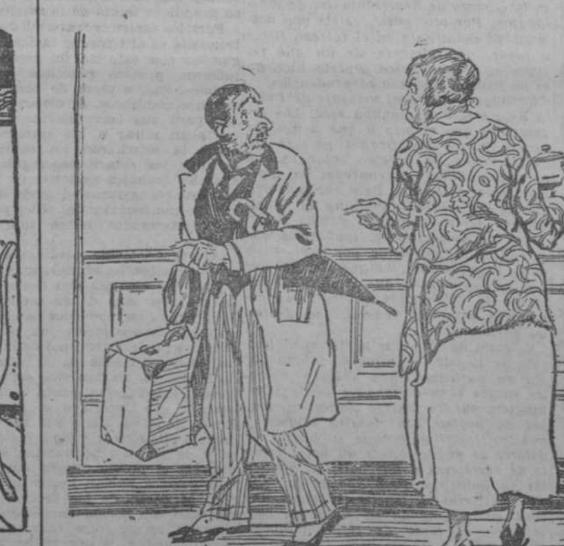
LA PATRONA.—¿Dónde va usted con esa maleta? EL HUESPED.—Pues... a... al Banco, a sacar dinero para pagarle a usted. (London Opinton, Londres.)