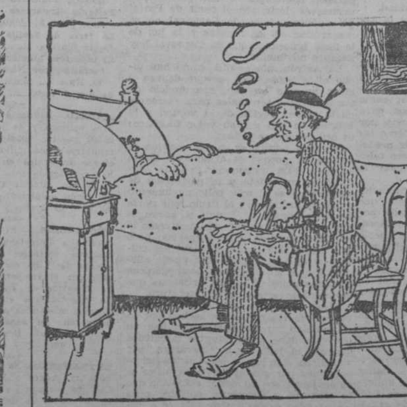
—¿De modo que te han dado mil duros como indemnización por el atropello de que fuiste víctima? ¿Y qué vas a hacer ahora? —Comprarme un automóvil. (Pain, Viena.)