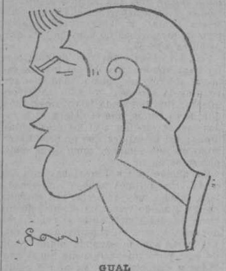
Delantero centro del Real Madrid F. C.