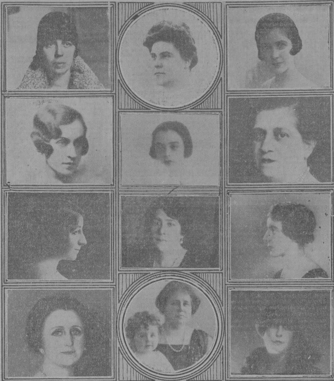
De izquierda a derecha: Duquesa de Nájera, marquesa del Riscal, marquesa de Camarasa, condesa de Campo de Alange, marquesa de Viana, marquesa de Argüelles, duquesa de Dato, condesa de Salvatierra, duquesa de Lécerca, marquesa de Bedmar, duquesa de Terranova y duquesa de Algeciras.