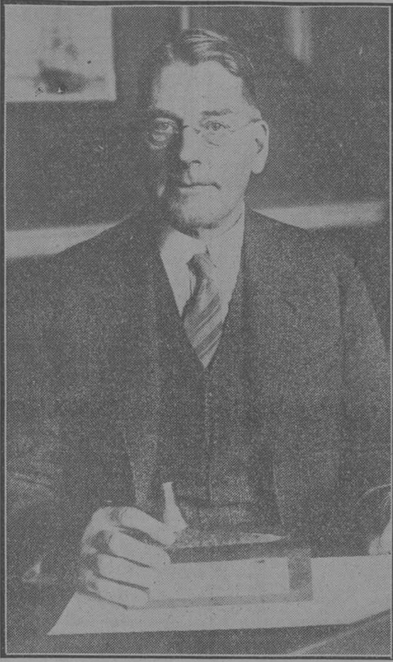
Curtis D. Wilbur, ministro de Marina norteamericano, responsable del nuevo programa de construcciones navales

El nuevo programa naval yanqui ha levantado tales protestas, que ya se habla de reducirlo a menos de la mitad. Aun así sería un esfuerzo notable, puesto que el programa completo—barcos, astilleros, soldados y aviones—costaría unos 26.000 millones de pesetas. El ministro de Marina ha hecho de ese programa una defensa original. En un discurso pronunciado en Indianópolis ha afeado a las mujeres norteamericanas su proceder regateando a la nación un sacrificio de 26.000 millones de pesetas en nueve años, cuando en un solo año gastan ellas en bombones una cantidad igual y en perfumes y pinturas dos veces y media —75.000 millones!—la suma citada. Por falta de psicología, debía Wilbur ser obligado a dimitir.