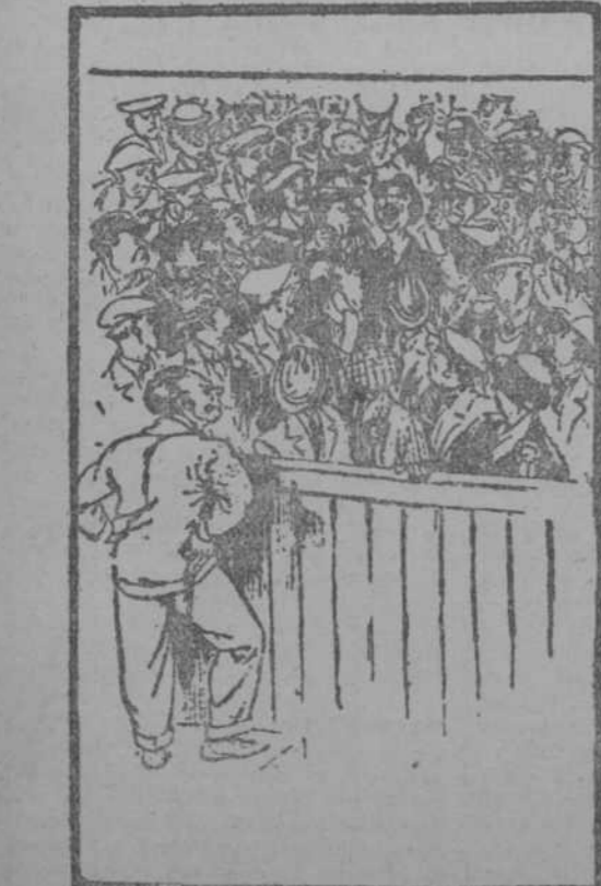
—Las tragedias de la vida El orfeonista que sigue cantando cuando ya ha terminado la canción.