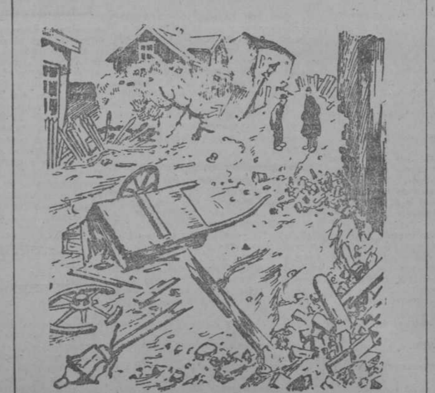
—¿Ha ocurrido algún terremoto? —No; es que Peterson está enseñando a conducir a su mujer.