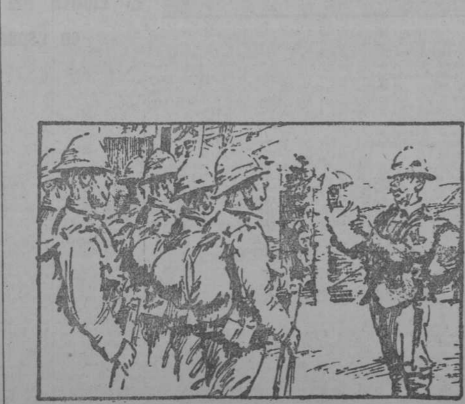
—Como medida disciplinaria, a todo soldado que se encuentre negociando con el enemigo se le fusilará en el acto, para que, en lo sucesivo, se porte como manda la ley.