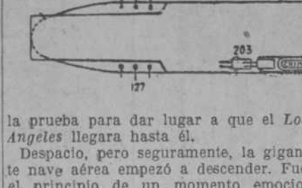
La prueba para dar lugar a que el «Los Angeles» llegara hasta él. Despacito, pero seguramente, la gigantesca nave aérea empezó a descender. Fué el principio de un momento emocionante. En la superficie del océano estaba el buque porta-aviones moviéndose sin duda con exceso, con su extensa cubierta, que ofrece seguro campo de aterrizaje para los aeroplanos, pero que para un dirigible—y los miembros de la tripulación así lo reconocían—era poco seguro.

He aquí una fotografía del «Saratoga» en un testigo, a pesar de sus proporciones monstruosas (27 metros de ancho y 32 metros de diámetro, y con 70.000 metros cúbicos de gas); proyectaba una sombra como la de un cigarrero puro sobre el «Saratoga», donde la tripulación estaba preparada para coger los cables de amarre.