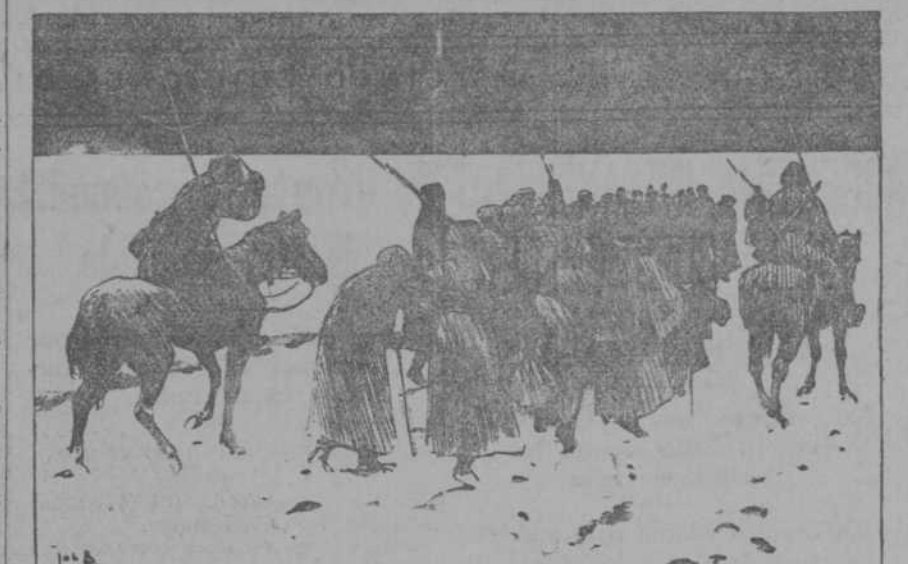
«No merecía la pena de haber derribado al Zar: todavía existe Siberia» (De Groene Amsterdammer.)