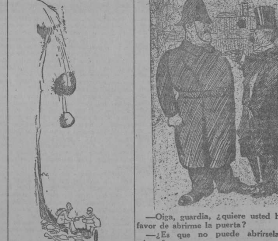
—¿Cuántos terrones? —Dos. (Dublin Opinion, Londres.)