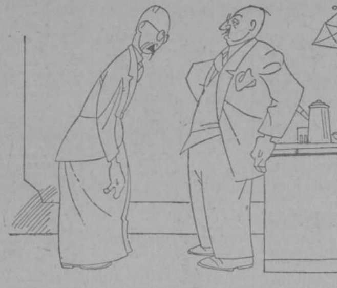
—Pero, diga usted, Pérez, ¿es posible que su mujer le obligue a hacerse unos pantalones tan ridículos? —Sí, señor; porque luego ella, que es muy hacendosa, saca de aquí un traje para el niño, dos portiers y un tapete para el comedor.

«¿Qué le había retenido? ¿Qué obstáculos que le cerrasen el paso había encontrado en su camino? Cuando se convenció de que Andoche había perdido el conocimiento, se olvidó de todo, de su situación, de la necesidad que tenía de apoderarse del documento probatorio de su inocencia, del robo del papel, para pensar sólo en acudir en auxilio del hombre que había intentado salvarle; devolverle la libertad, restituirle el honor mancillado. Se dispuso a volver al «Cabaret del Rey» para pedir socorro, cuando oyó un agudo grito de susto y de sorpresa a la