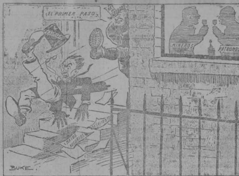
EL PRIMER PASO HACIA LA SOLUCION (Del Western Mail, Cardiff.)