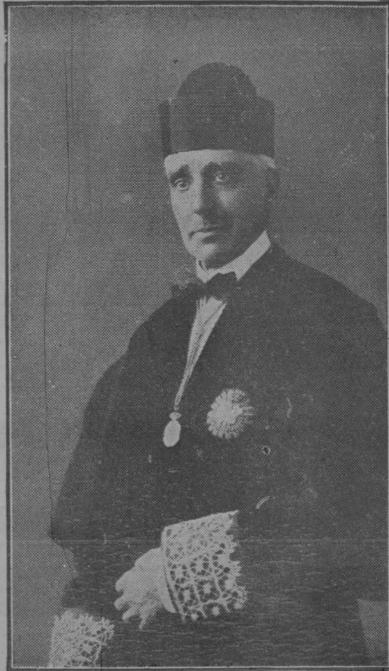
Don Eduardo de León Ramos, nuevo presidente de la Audiencia territorial de Madrid.

El premio Piquer de teatro para 1928. La Real Academia Española adjudicará en 1928 un premio de 1.600 pesetas a la mejor obra dramática estrenada en alguno de los teatros del Ritz durante el año 1927, compuesta en lengua castellana por literatos españoles, siempre que la que aventaje en mérito a las demás le tenga suficiente, a juicio de la Corporación, para lograr la recompensa.