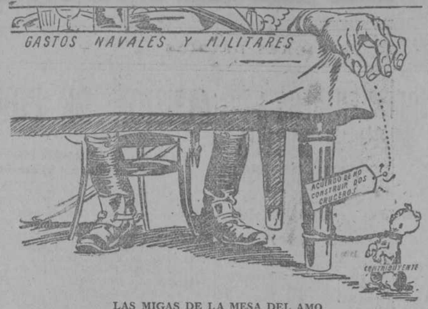
LAS MIGAS DE LA MESA DEL AMO (The Daily Chronicle, Londres.)

«The Daily Chronicle» es el órgano de los liberales ingleses. Hasta hace medio año era propiedad, casi por entero, de Lloyd George, y ahora está en poder del ex virrey de la India, Lord Reading. Los liberales atacan al Gobierno inglés, porque no ha hecho todo lo posible por acelerar el desarme.