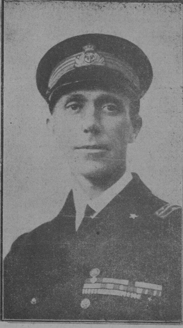
El Príncipe de Udine, jefe de la Escuadra italiana que acaba de visitar Tánger

Fernando Humberto, primer Príncipe de Udine, tiene en las venas sangre de marinos. Su padre es el duque de Génova—magnífico título para un príncipe—y estaba al frente de la Escuadra italiana que recibió a nuestros Reyes en Spezia. El Príncipe de Udine ha salido ahora al mar con una Escuadra reducida, barcos pequeños y rápidos, como conviene a quien va a hacer una advertencia. Muy gentilmente inaugurando una escuela, presidiendo la apertura de un dispensario. Pero esto ocurría allí en una ciudad que se llama Tánger, y que parece estar embrujada.