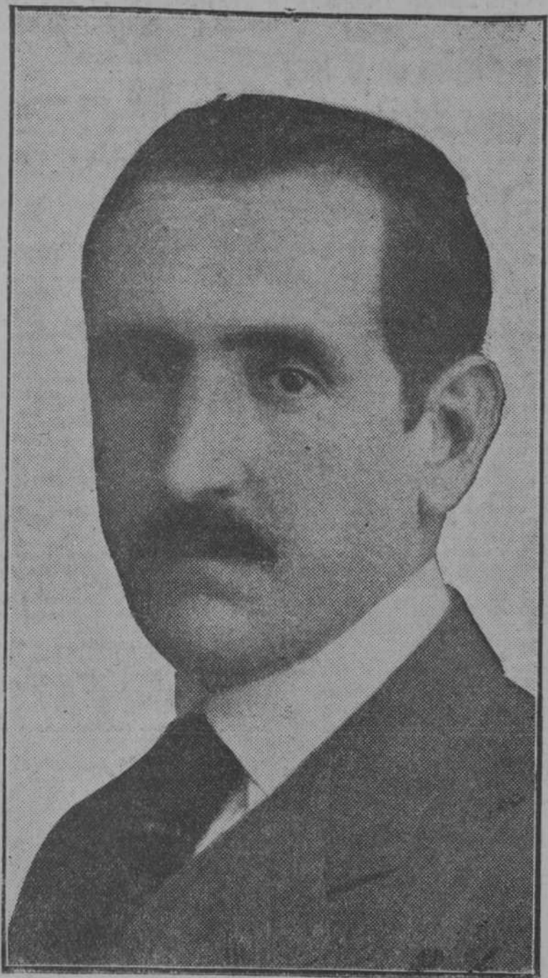
El arquitecto don Teodoro Anasagasti, elegido académico de Bellas Artes

El señor Anasagasti, natural de Bermeo (Vizcaya), fué premiado en 1911 en un certamen internacional que se celebró en Roma. Concurrieron al certamen arquitectos de muchos países y se concedieron seis premios. La obra presentada por el señor Anasagasti fué un proyecto de monumento a la reina Cristina.