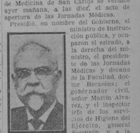
Prof. Rodolfo Matas, de la Escuela de Medicina de Nueva Orleans.

El objeto no carece de valor en esta hora de crisis de los partidos. Esos, que han tratado de ofrecer un cauce a la democracia, no se han demoralizado en su régimen inferior. Formados alrededor de una persona—la del jefe—, apenas han sentido otras inquietudes que las del escalafón. Pero la democracia directa, que tiende a participar en el régimen del Estado, penetra también en la estructura de los partidos; los afiliados disienten los programas, designan sus Comités y se reúnen en Asambleas o en Congresos; así se constituyó el Partido Social Popular, que, a pesar de tener tantos hombres de mérito, no designó un jefe, sino un Directorio temporal y responsable. De este modo también llegarán a proponerse los candidatos, y entonces el personal político podrá ser una selección nacional, emancipada de las querrelas locales. Las ideas tendrán más importancia que los hombres, y el verdadero talento político no se confundirá con la habilidad rural. Carlos Ruiz DEL CASTILLO