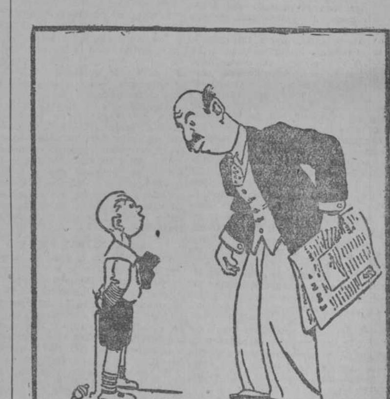
—Las personas menores no contestan a las mayores. —¿Ah, sí? ¿Y por qué mamá, siendo menor que tú, te contesta y te aguantas? (Fantasio, París.)