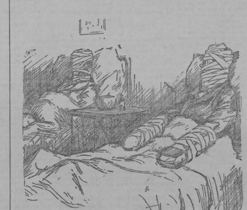
—Caballero, su cara de usted no me es desconocida. —Seguramente nos habremos visto antes en la carretera. (London Opinion, Londres.)