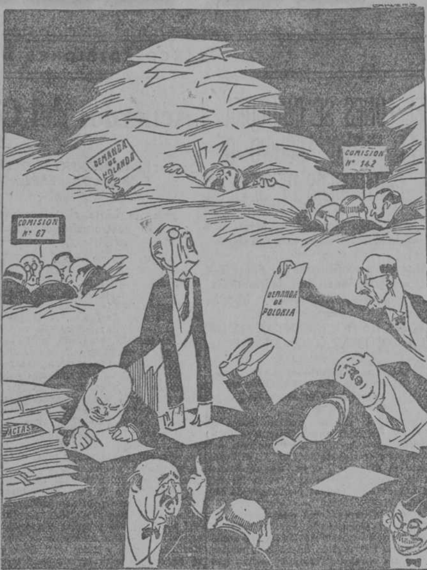
TODO APLAZADO EN GINEBRA (Kladderatsch, Berlín.)