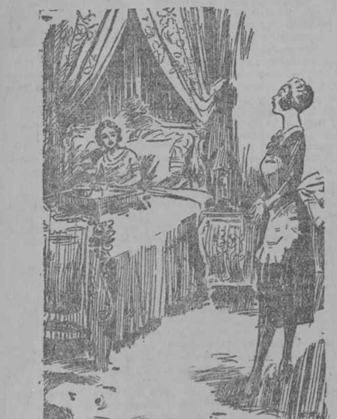
LA SEÑORA.—¿Ha enviado el farmacéutico la medicina para poder dormir? LA DONCELLA.—No, señora. LA SEÑORA.—Pues vaya usted y dígame si es que cree que me voy a pasar toda la noche en vela sólo por esperarla. (Passing Show, Londres.)

«El Santo Padre, muy agradecido al homenaje de los peregrinos al santuario de la Virgen del Pilar, envía de corazón la bendición apostólica.—Cardenal Gasparri»