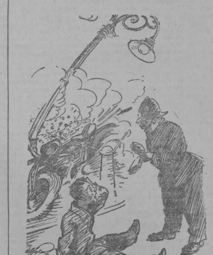
—¿Cómo ha sido? —Pues verá usted. Yo veía correr los árboles a mi lado, cuando de pronto este poste va y se para. (Passing Show, Londres.)