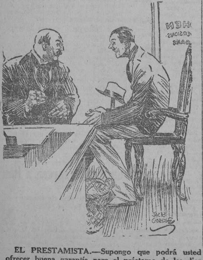
EL PRESTAMISTA.—Supongo que podrá usted ofrecer buena garantía para el préstamo de las diez mil liras. EL JOVEN.—Sí, señor. Precisamente ayer me dijo una adivinadora que voy a heredar una fortuna muy pronto.