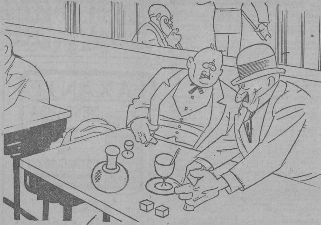
—El me llamó camello, rinoceronte y jirafa. —¡Pero, hombre! ¿Todo por ese estilo? —¡Ah! Es que yo le dije que no le toleraba una palabra más alta que otra.