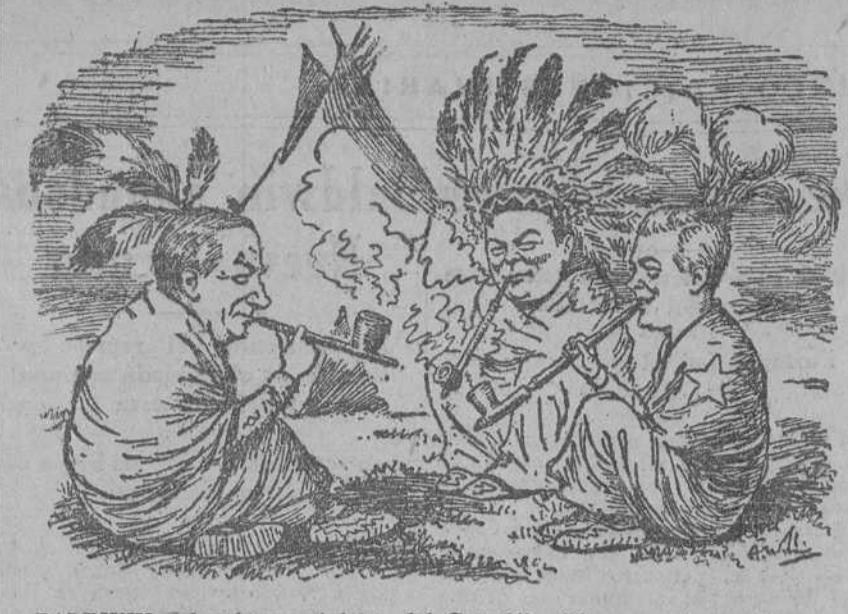
BALDWIN (al primer ministro del Canadá).—Me encuentro aquí como en mi propia casa. EL PRINCIPE DE GALES.—Hace años que yo me he encontrado igual. (De News of the World, Londres.)