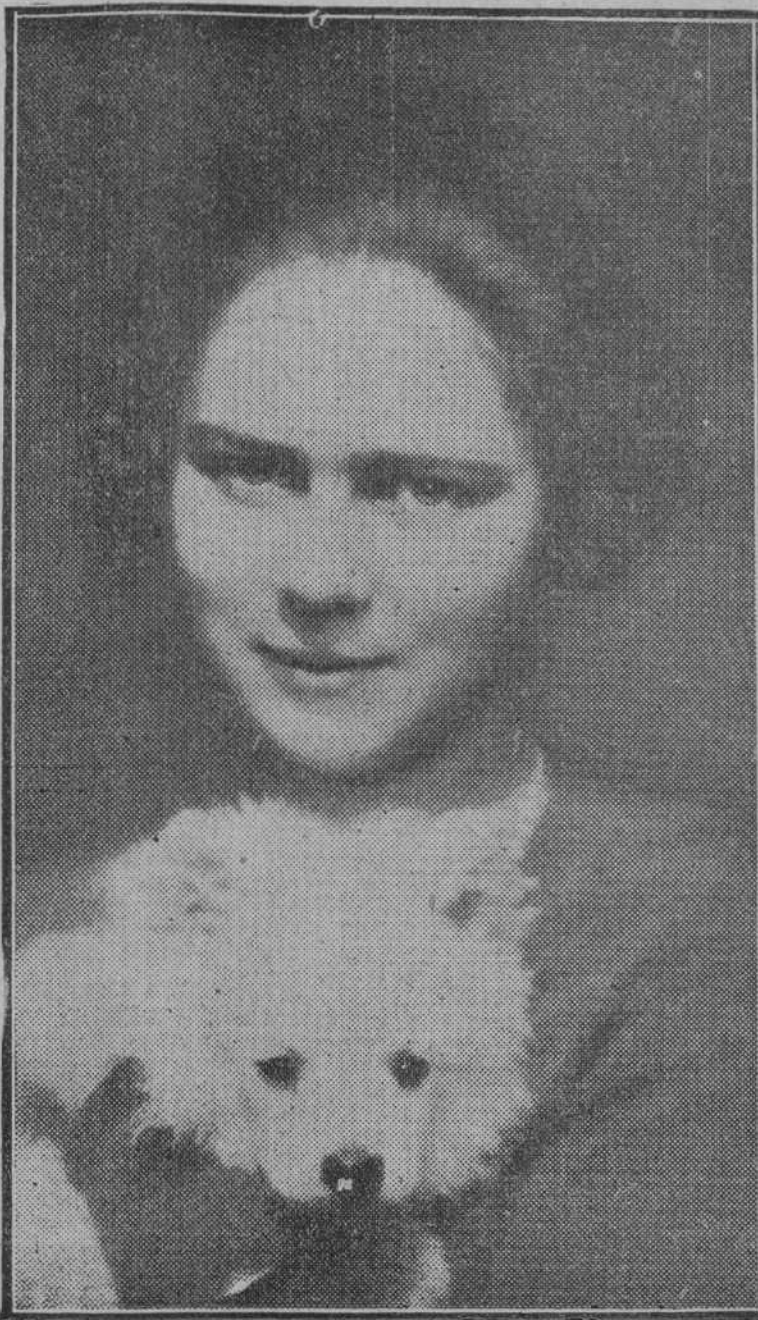
La princesa Ileana de Rumania

Según el corresponsal en Belgrado del «Daily Express», la más joven de las Princesas rumanas va a ser pedida en matrimonio por el rey Boris de Bulgaria. La gentil princesa Ileana nació en 23 de diciembre de 1908; cuenta, pues, diez y nueve años escasos. A su madre, la reina María, va a ser llamada la «Suegra de los Balcanes» porque sus dos hijas mayores, las princesas Isabel y María se casaron, respectivamente, con el último Rey de Grecia, Jorge II, y con el rey Alejandro I de Yugoslavia. El matrimonio de la princesa Ileana con el rey Boris acabaría de entrelazar con vínculos de sangre a las cuatro dinastías balcánicas.