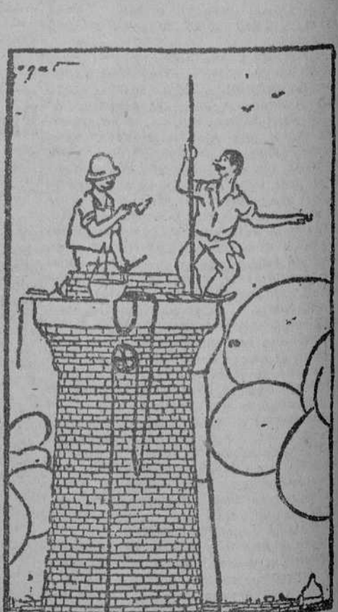
—¿Quién? ¿Anchonelli? Lo conozco yo desde que era así de pequeño. (Pasquino, Turin.)