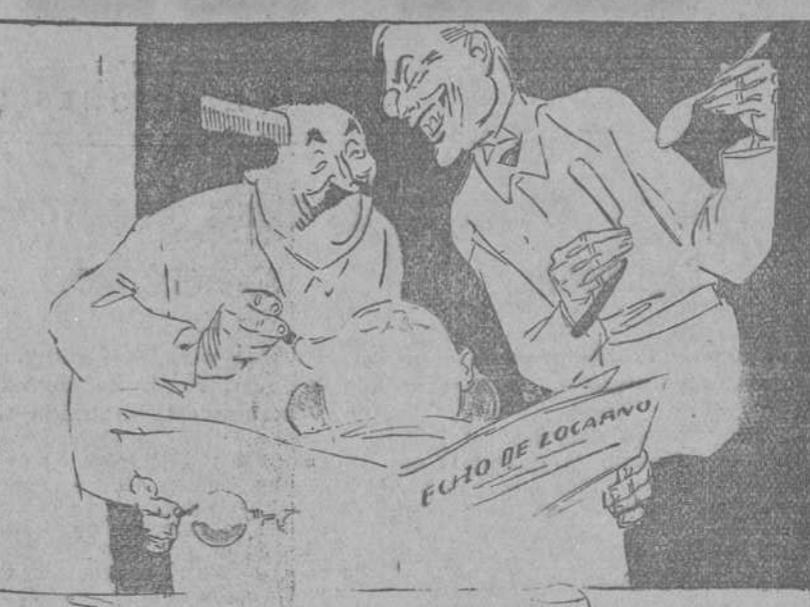
CHAMBERLAIN.—Enjábóncelo usted bien, querido colega. Así me será más fácil darle un buen afeitado. (Kladderdeutsch, Berlín.)

El personaje que está sentado es Stresemann. Briand, persuasivo orador, es el encargado de convencerle para que se deje arrancar las concesiones necesarias.