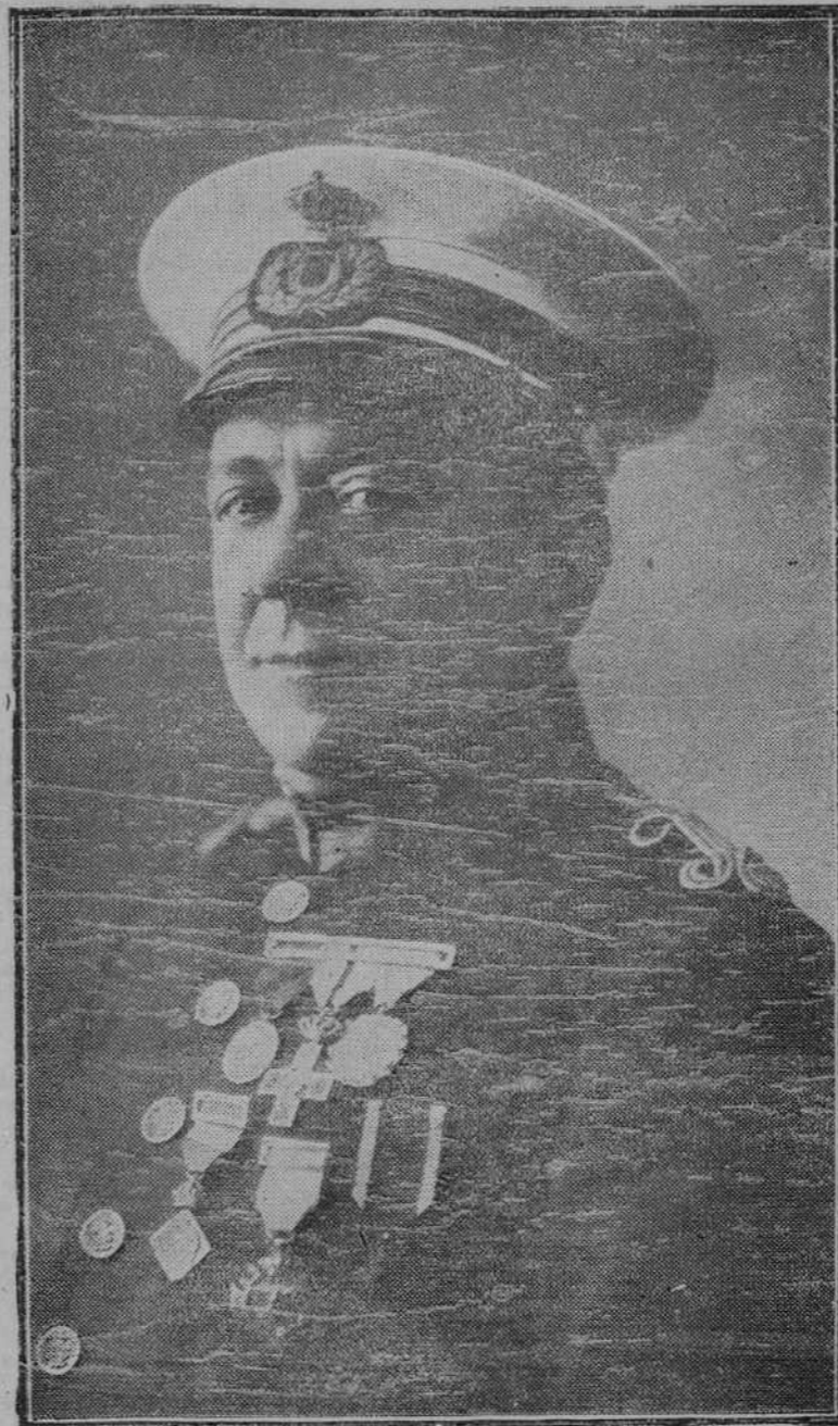
El director de la Banda Municipal de Madrid, que ha obtenido un triunfo en Lisboa