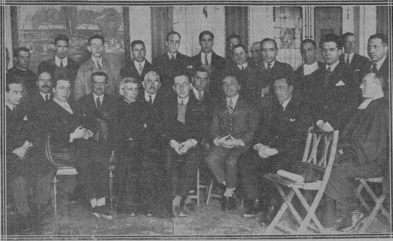
Los delegados de las Juventudes católicas de Asturias, reunidos en Oviedo para elegir nueva Directiva de la Federación (Fot. Buelto).