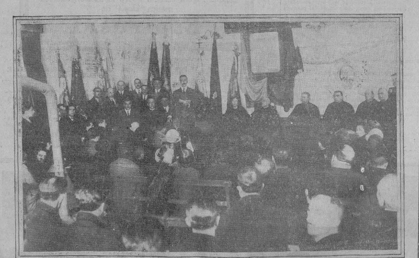
Solemne sesión de apertura, presidida por el Cardenal Primado, del Congreso de obreros católicos, que se celebra en su Casa Social de esta Corte.