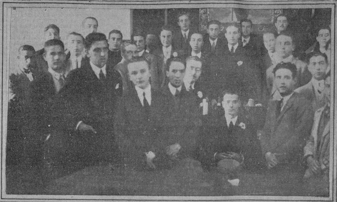
Los delegados de las Federaciones regionales de estudiantes católicos con la Presidencia en el acto de inauguración del V Congreso de estudiantes católicos, celebrado en el paraninfo de la Universidad de Granada