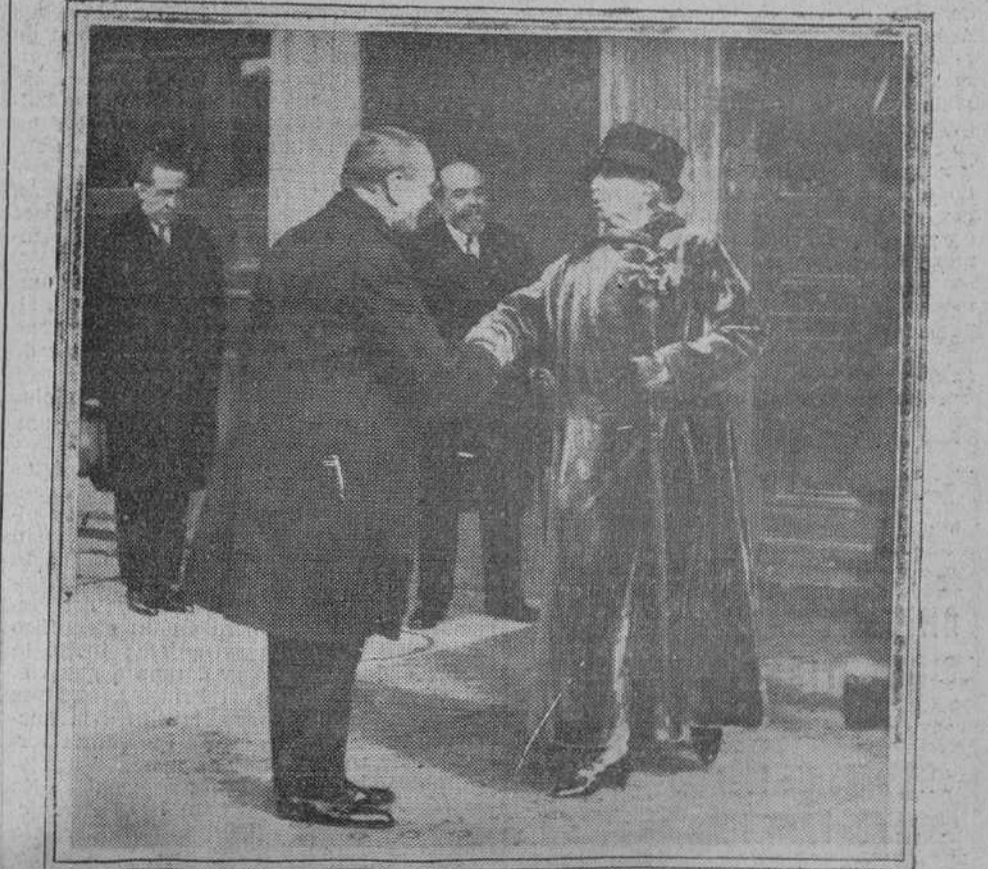
El ministro de la Gobernación dando la bienvenida a su majestad la reina Cristina a su llegada ayer mañana a Madrid de regreso de San Sebastián