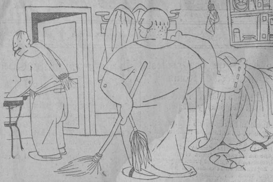
LA PATRONA.—Pero ¿se ha fijado usted, don Servando? ¡Na, que se han empeñado en amolarnos! ¡Qué pesaos! EL HUESPED.—¡Y qué chinchest!