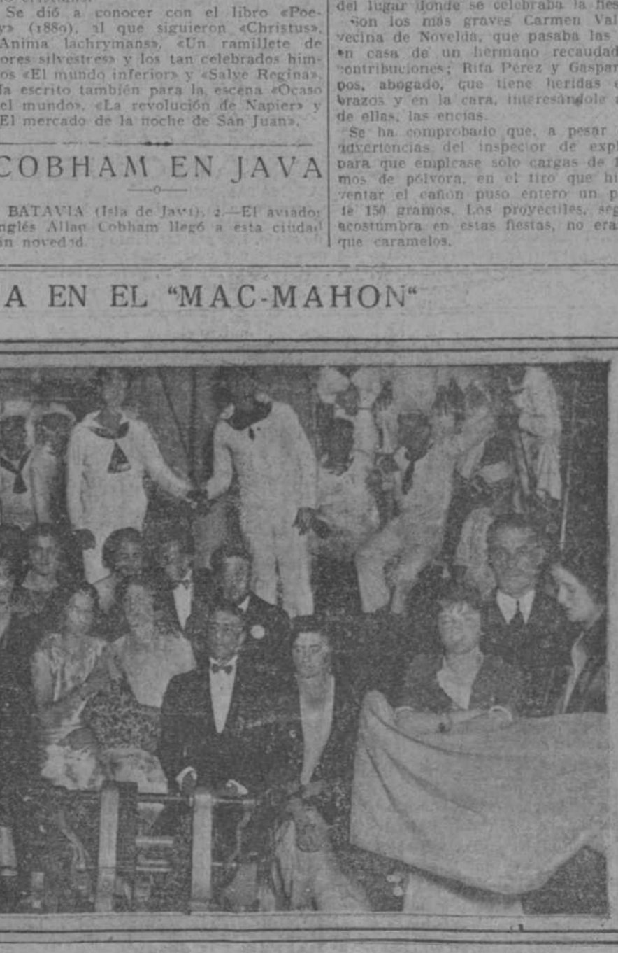
Grupo de señoritas de San Sebastián durante la fiesta a bordo del cañonero «Mac-Mahon»