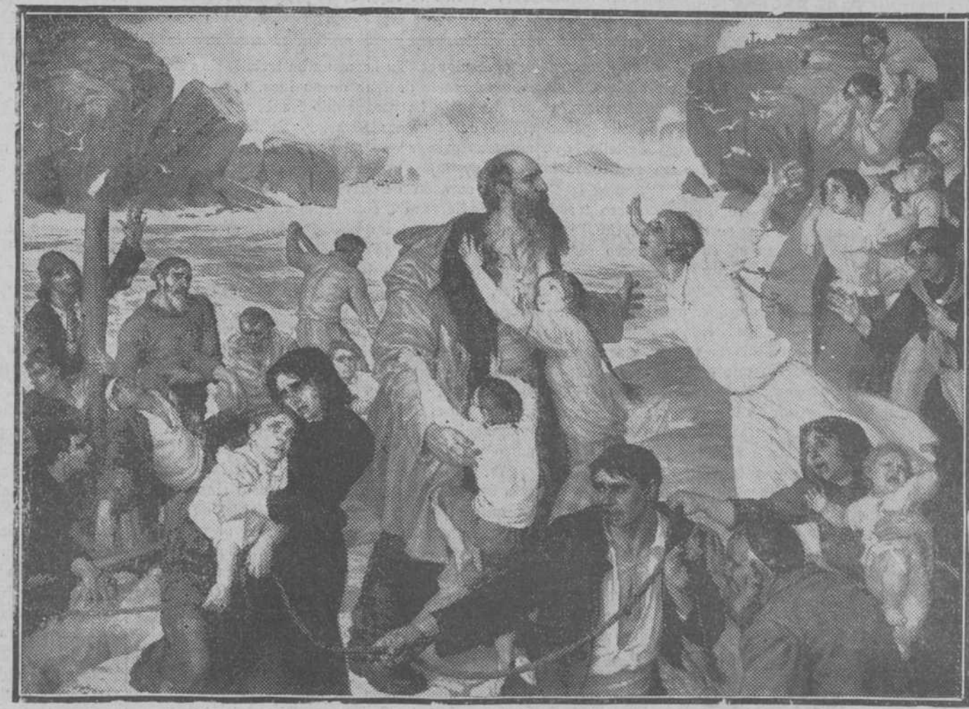
«Galerna», cuadro de Nicolás Sofía