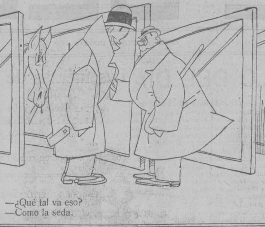
—¿Qué tal va eso? —Como la seda.