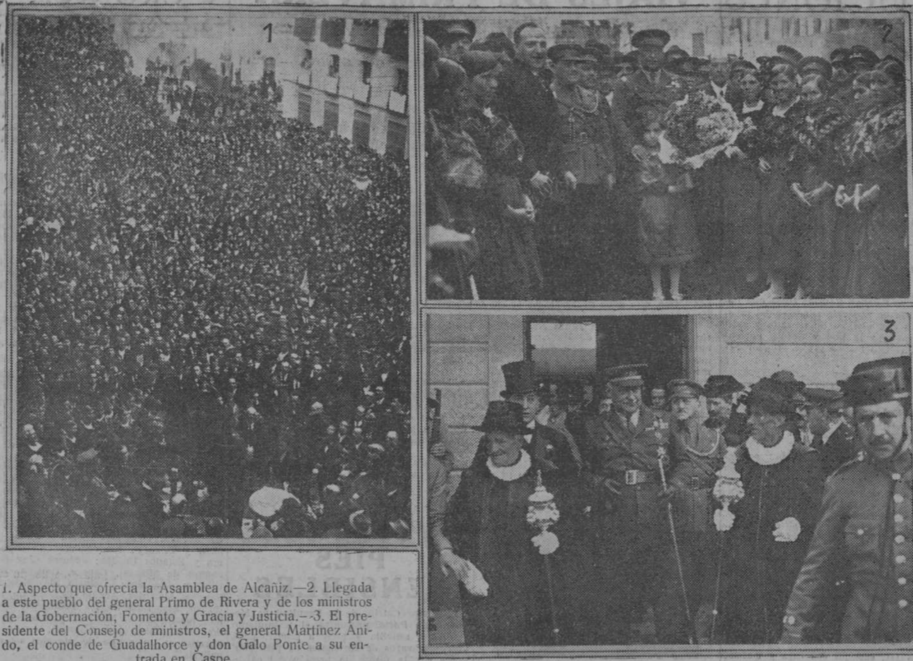
1. Aspecto que ofrecía la Asamblea de Alcañiz.—2. Llegada a este pueblo del general Primo de Rivera y de los ministros de la Gobernación, Fomento y Justicia.—3. El presidente del Consejo de ministros, el general Martínez Anido, el conde de Guadalhorce y don Galo Ponte a su entrada en Caspe