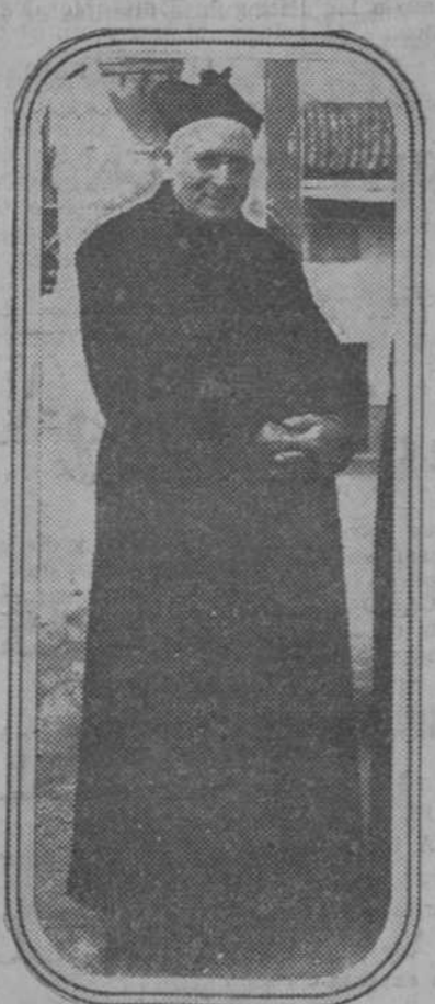
El rector mayor de los salesianos, don Felipe María Rinaldi, que el domingo llegó a Madrid para presidir las fiestas que en las escuelas salesianas se celebran, conmemorando las bodas de plata de su fundación.