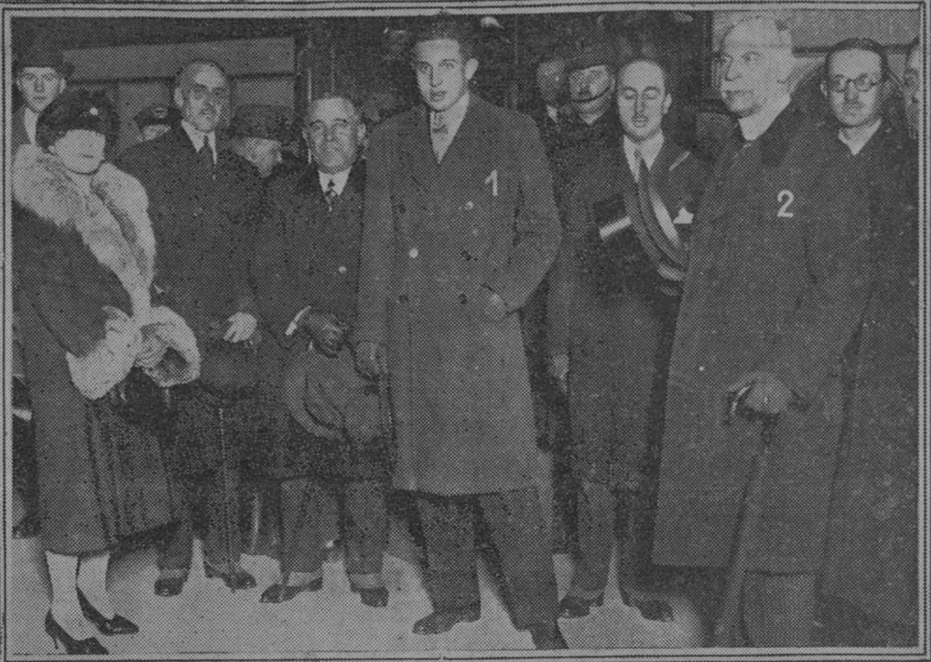
Su alteza (1), al salir de la estación, acompañado del embajador español, señor Merry del Val