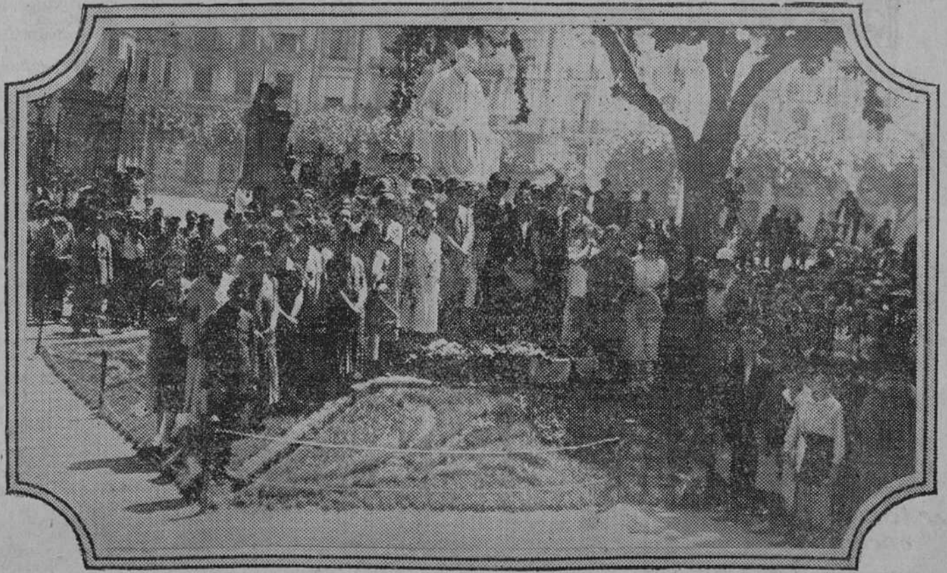
El orfeón navarro ante el monumento a Salvador Ginés