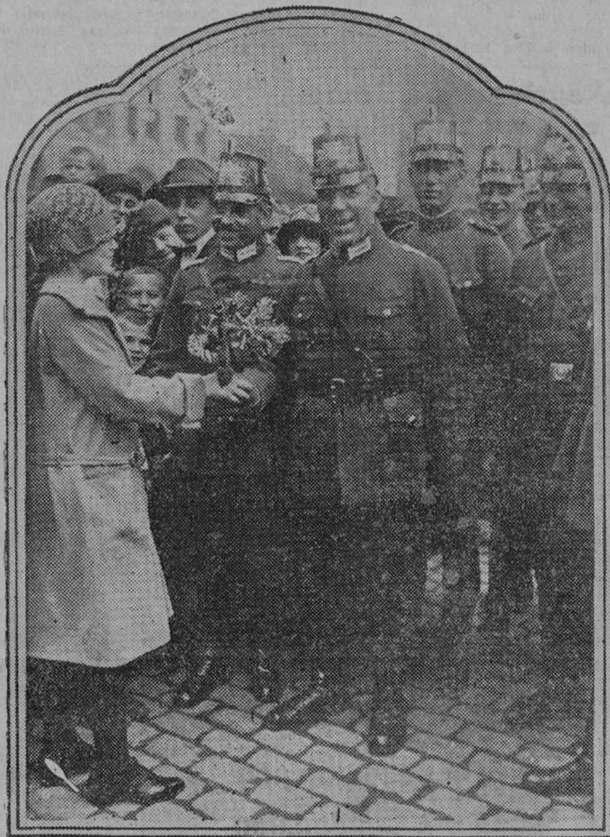
Entrada de la guardia de Seguridad alemana en Essen, después de la evacuación del Ruhr. La población le tributa un entusiasta recibimiento, obsequiando a los policías con ramos de flores