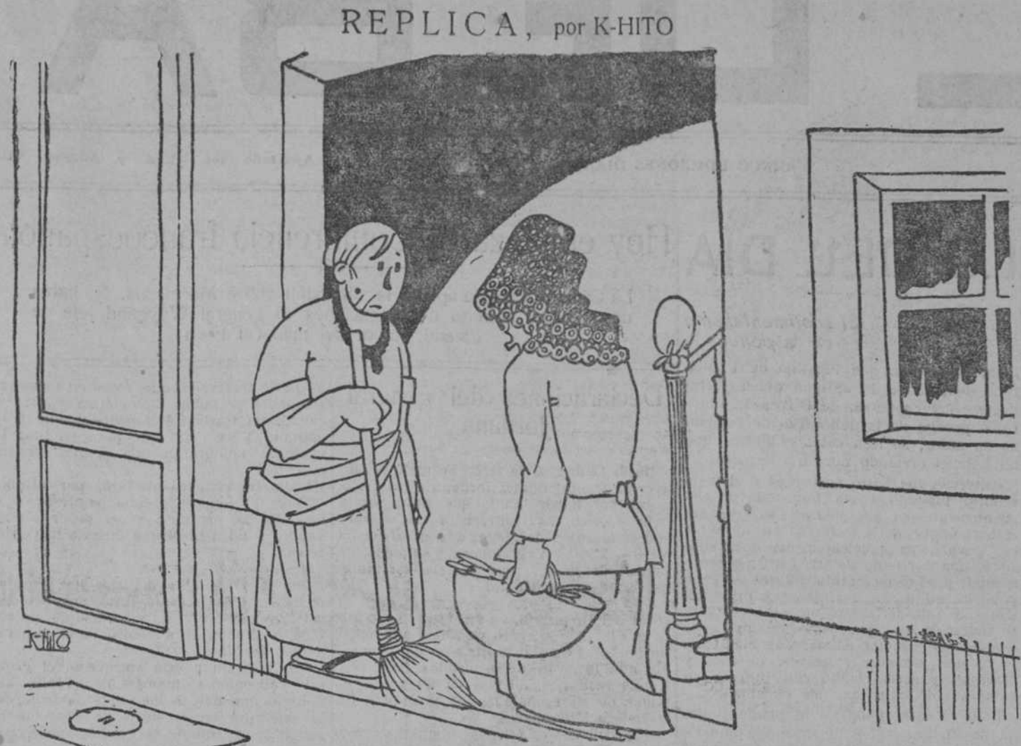
—Hay que tener más cuidado, portera. Evite usted que entre el aire, y la basura, y los microbios... —La señorita me toma por Zamora, ¿verdad usted?

Una columna que salió de Dar Quebdán abasteció las posiciones de aquel sector, regresando sin novedad a su base.