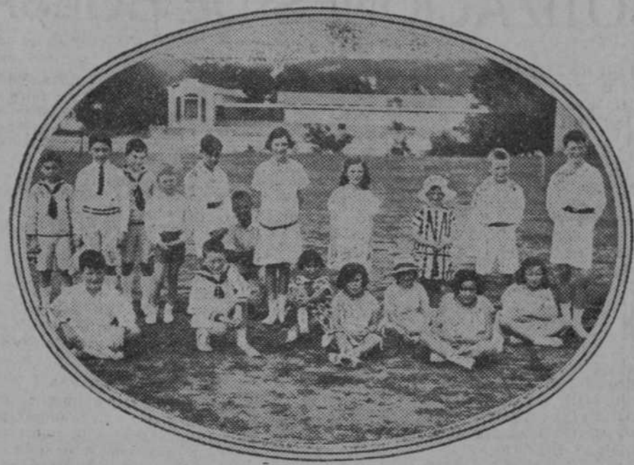
Niños que tomaron parte en el festival deportivo, organizado por la colonia inglesa en Madrid, para conmemorar la coronación de Jorge V.