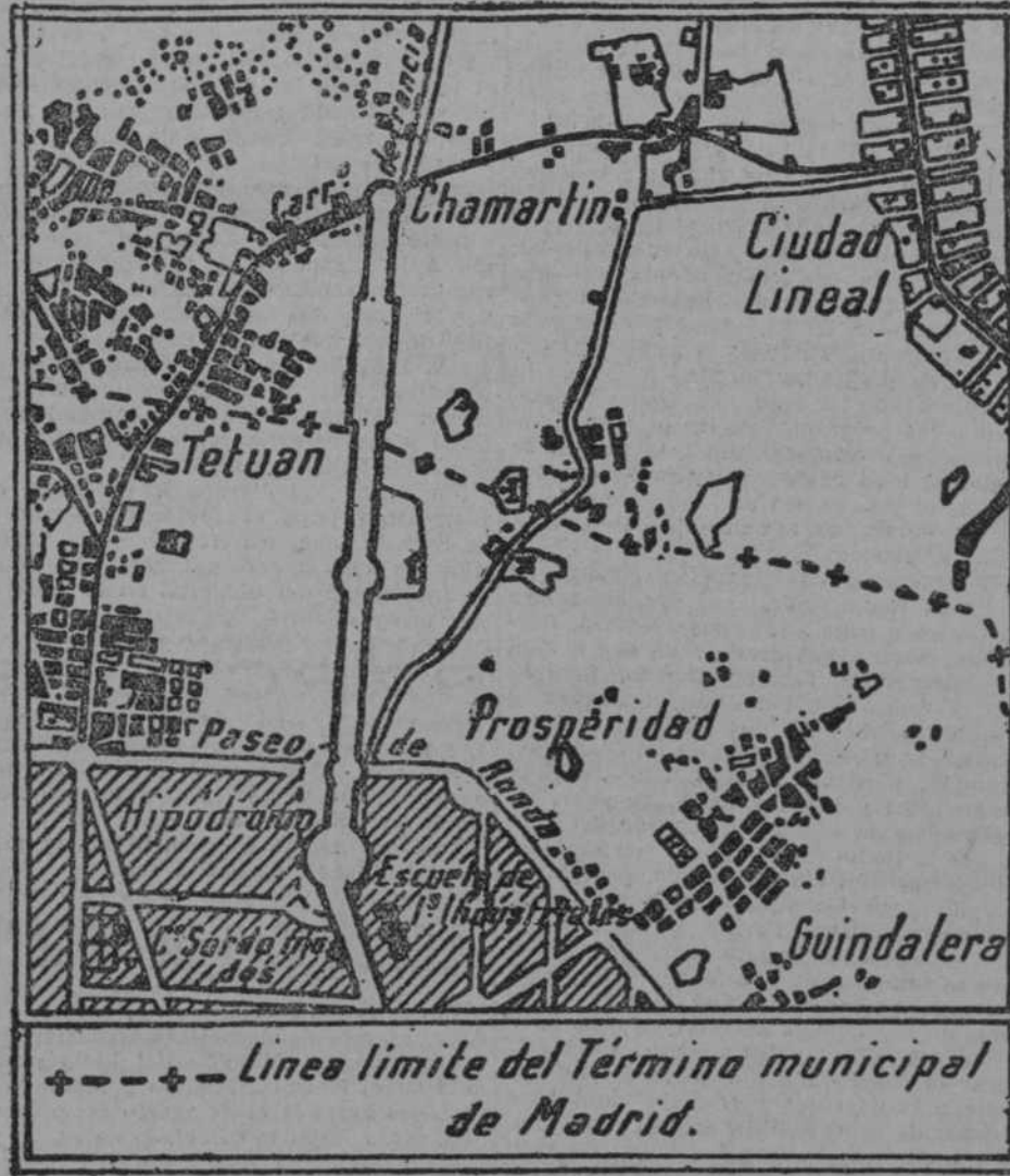
Gráfico aproximado del proyecto de prolongación de la Castellana, tomado de los proyectos de los señores Núñez Granés y Salaberry

En el Ayuntamiento se espera que la tramitación sea rapidísima.