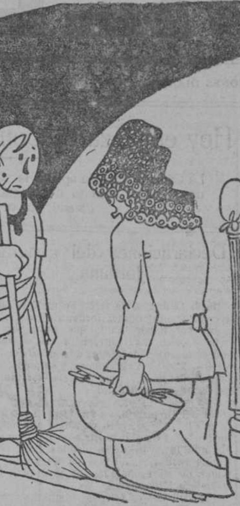
—Hay que tener más cuidado, portera. Evite usted que entre el aire, y la basura, y los microbios... —La señorita me toma por Zamora, ¿verdad usted?