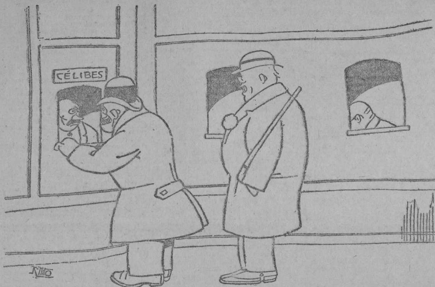
EL CÉLIBE.—¿Cuánto es? EL EMPLEADO (mirándole fijamente la cara).—Para usted, nada. Lo consideraremos como caso de fuerza mayor.