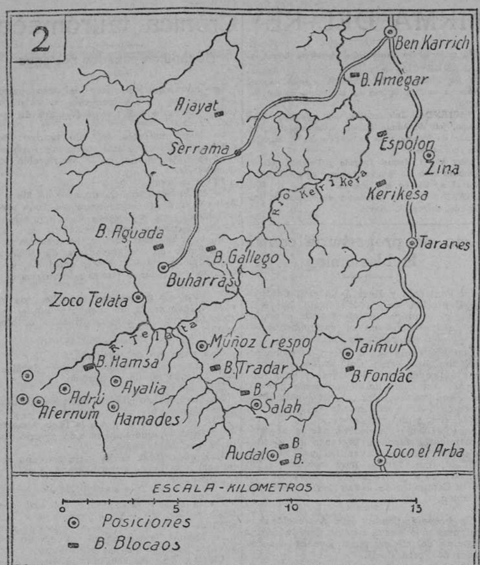
ESCALA - KILOMETROS