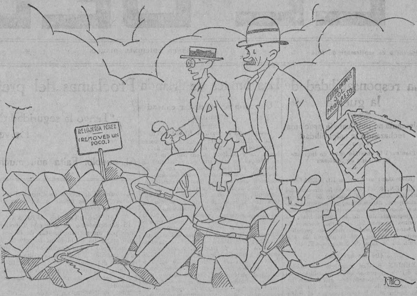
—Y sobre todo, hijo mio, mucho cuidado con este Madrid. ¡Es tan fácil irse por mal camino!