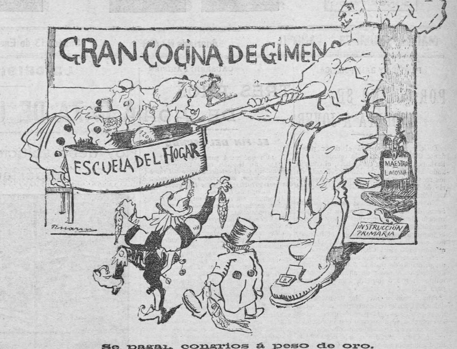
Se pagal congrios a peso de oro.