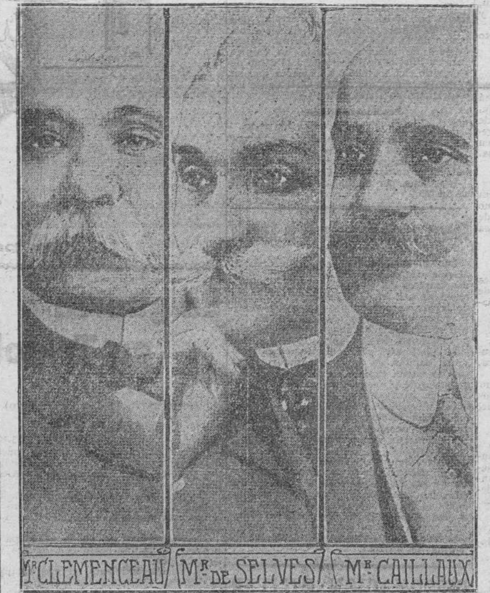
M. CLEMENCEAU M. DE SELVES M. CAILLAUX

Hoy debe solucionarse este importante problema político