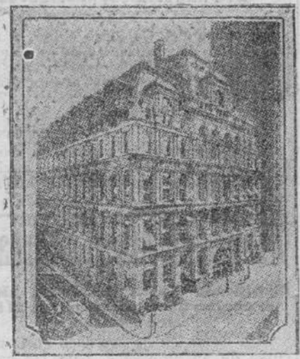
NUEVA YORK.—El grandioso edificio de La Equitativa de los Estados Unidos, que ha sido recientemente destruido por un incendio.

Declan los periódicos que el embajador francés iba á comprar una granja española. ¡A buena hora, mangas verdes! Dé-