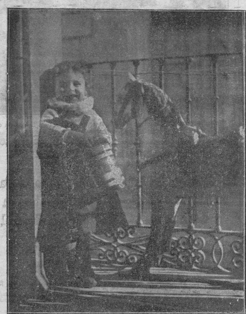
REGALO DE REYES

LOS UNIONISTAS INGLESSES (DE NUESTRO SERVICIO EXCLUSIVO) LONDRES 5. 18.