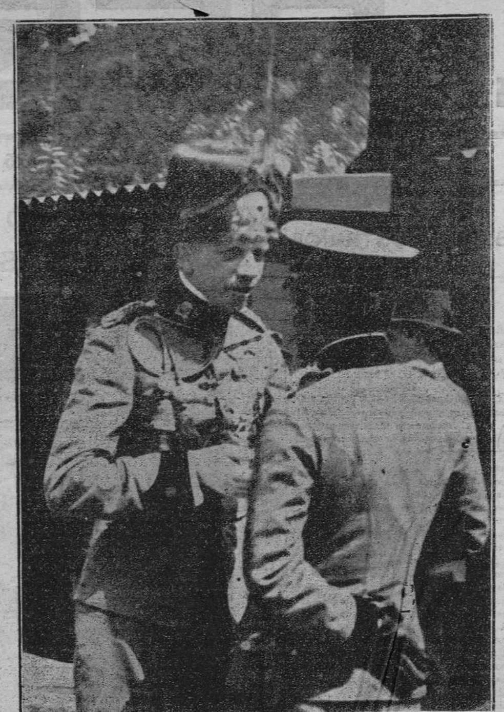
EL INFANTE DON FERNANDO, QUE HA SALIDO PARA LA GUERRA FORMANDO PARTE DEL REGIMIENTO DE LUSITANIA