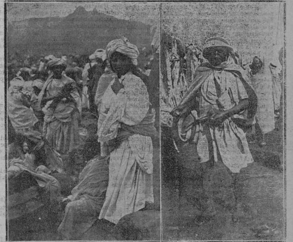
EL ZOCO DE BARRACA ARKEMAN, ZOCO DEL ARBA... Las vecinas del "Gurgú". Carnicería al aire libre.

El horror a la fotografía. El "tebib" de Beni-bu-Iffror. Las mantas morellanas. ¡Se vende el caballo!