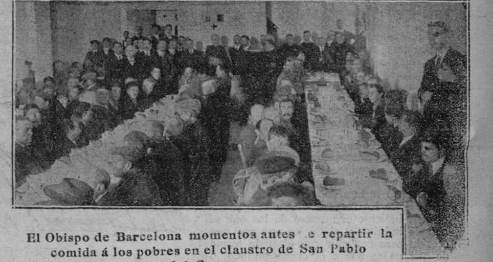
El Obispo de Barcelona momentos antes de repartir la comida á los pobres en el claustro de San Pablo del Campo.

Jaurés replica, diciendo que la indignación patriótica ha ilustrado siempre á los partidos que ponen en peligro á la patria.