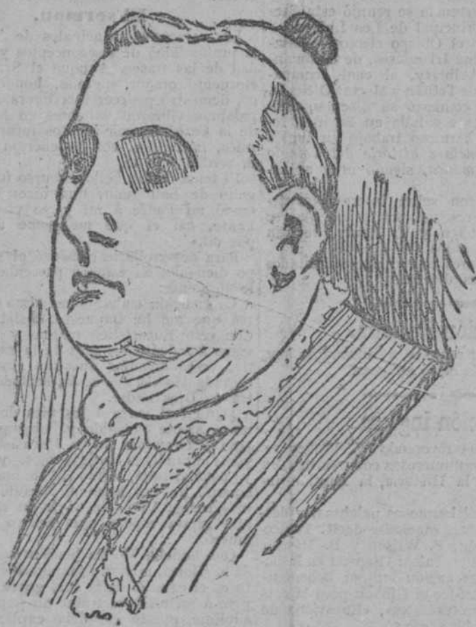
EXCELENTÍSIMO SEÑOR DON ENRIQUE ALMARAZ, Arzobispo de Sevilla, que pronunció un discurso brillantísimo ensalzando la obra de la Prensa católica.

Comienza diciendo en francés, que España es la tierra católica por excelencia; el único país que resistió victorioso á la invasión del mal moderno. Considera la actual religiosidad española comparable á la que reinaba en los gloriosos tiempos de los Reyes Católicos.