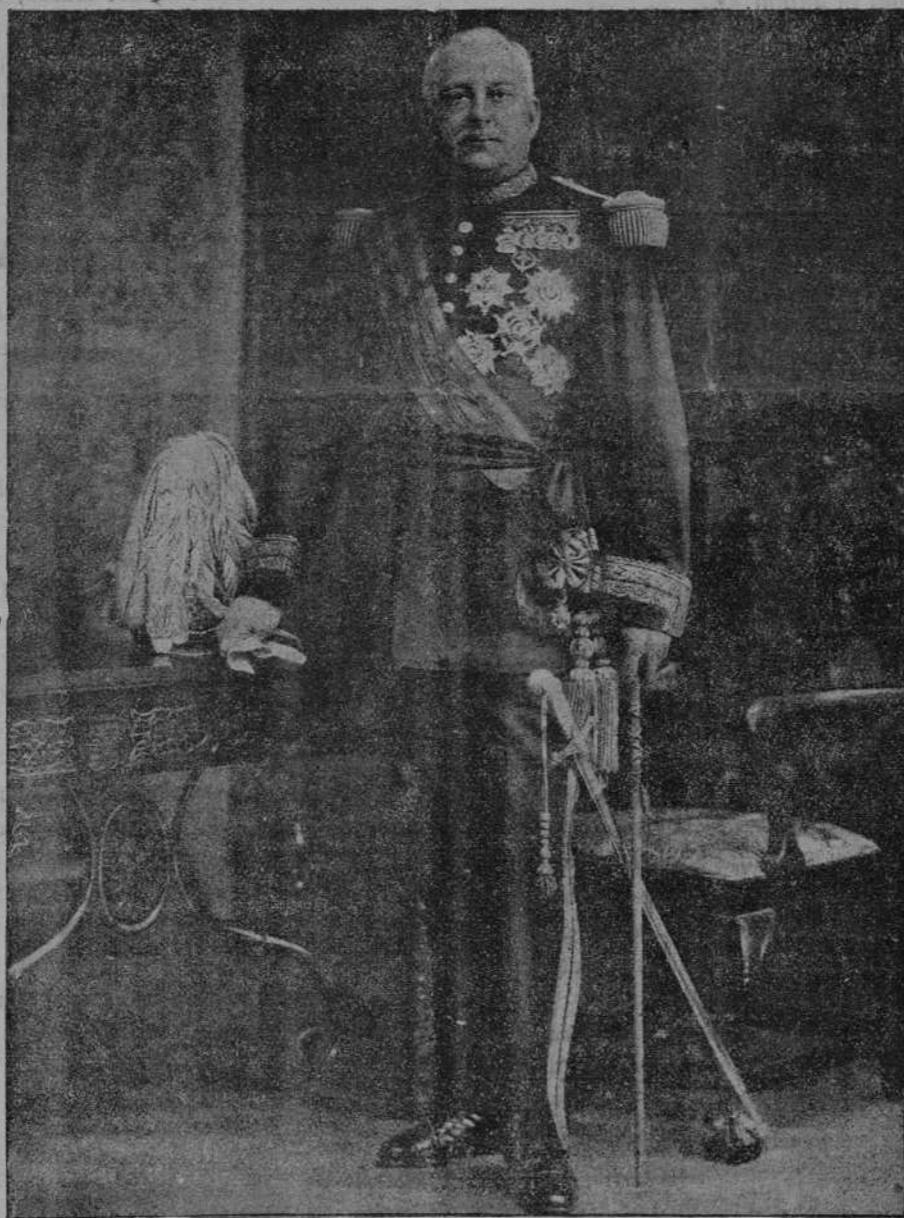
EXCMO. SR. D. MIGUEL PRIMO DE RIVERA

Ha sido extraordinaria la afluencia de personalidades que acudieron a casa del