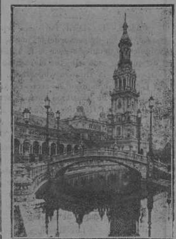
Un aspecto de la Plaza de España.—Arquitecto: Anibal González.

En ninguna otra Exposición del mundo, ni en las por mí visitadas de París, Burdeos, Milán, Bélgica, etc., he podido