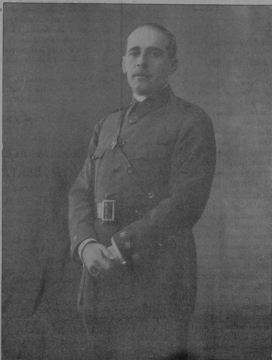
El culto y bizarro coronel de Infantería D. Rafael Duyos Sedó, cuyo retrato honra hoy nuestra galería de figuras militares, es uno de los jefes del Ejército más prestigiosos, por su talento, su vasta ilustración y su brillante historial.