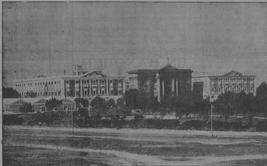
ESCUELA NAVAL MILITAR.—Fachada de la Escuela.

Después embarcan un año en buque a propósito, en el que verifican navegaciones largas, que comprenden viajes a América, en sus distintas especificaciones del Norte, Sur y Central, sufriendo al finalizar, un examen comprensivo de las materias más profundas de la carrera, con la práctica de la visita realizada, fábricas y arsenales recorridos, ejercicios practicados y juicio o criterio formado de la navegación moderna y sus adelantos.