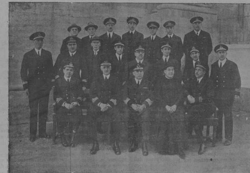
ESCUELA NAVAL MILITAR.—Grupo de profesores.

Finalmente, permanecen otro año en prácticas de escuadra, repartiéndose en los buques de la Flota de instrucción, ya con la categoría de alférez de fragata, y al finalizar este último periodo de la carrera, vuelven a esta Escuela a doctorarse, es decir, a sufrir un examen que pudiéramos llamar de reválida, previo unos meses de repaso y conferencias de consulta con los profesores de cada materia y salen ya a formar parte de la escala de oficiales, y a dotar los buques de guerra, no sin la obligación ineludible e imprescindible para el ascenso a teniente de navío, de hacer los estudios separadamente y concreta de una especialidad.