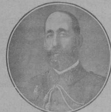
El general Navarro, barón de Casa Davalillos, que ha sido nombrado capitán general de Madrid, al cesar en este cargo el general Ardanaz.

Sagunto tiene por eso para todos los españoles una significación altísima. Es un símbolo de la devota consagración del Ejército a la Patria.