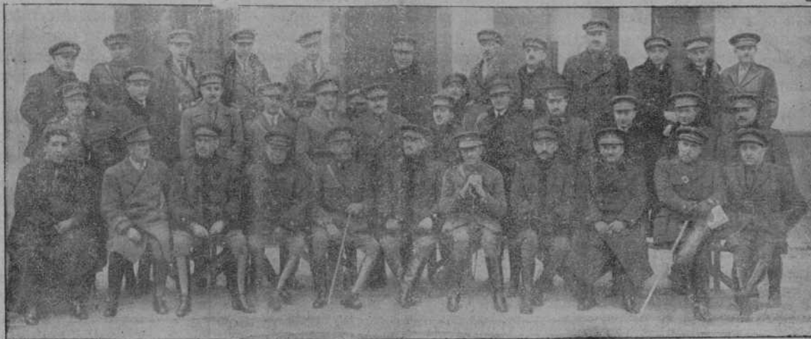
Grupo de jefes y oficiales del Regimiento de Infantería de Sicilia, de guarnición en San Sebastián.

el servicio no era exclusivo para Alemania, sino para Europa entera, para el progreso de la cultura, pensamiento que constituirá el faro directriz de la política alemana para llevar el tráfico aéreo al tipo de servicio internacional.