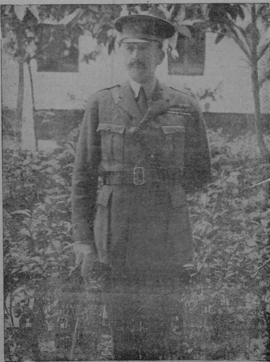
El excelentísimo señor don Francisco Mercafer, vizconde de Belloch, general de división, gobernador militar de Sevilla.