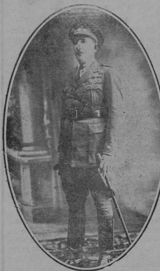
Don Angel Prats, valeroso coronel del regimiento de Ceuta, que se ha distinguido notablemente en cuantas operaciones ha tomado parte en Marruecos.