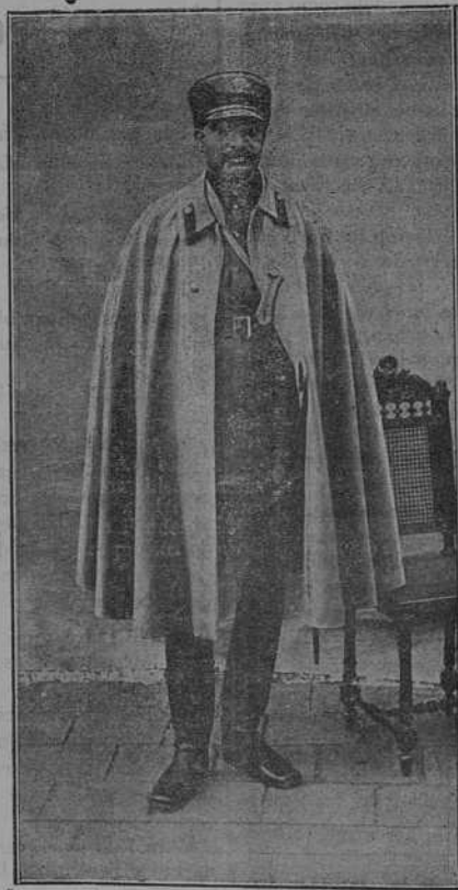
El dictador de Persia, general Riza Kham.