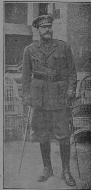
Don Joaquín Valderrama, distinguido coronel de Artillería del Ejército.