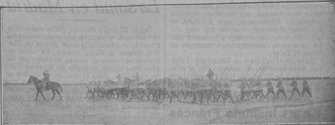
Las banderas del Tercio desfilando ante su comandante Sr. Franco, después de serle impuesta al bravo jefe la Medalla militar