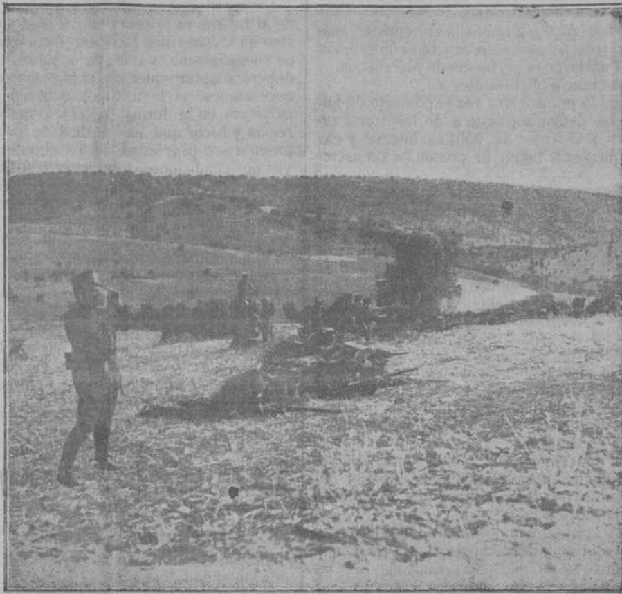
Una sección del regimiento del Rey en un simulacro de combate

El día 9 se celebrará en Braga la sesión inaugural del Congreso católico.