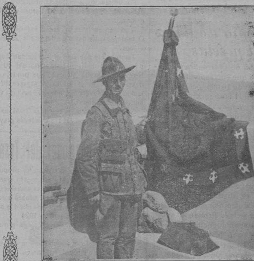
MARRUECOS.—Bandera de los legionarios

«El criterio sostenido por el Gobierno francés es que el de España podía hacer extensiva a sus posesiones la tarifa arancelaria gene-