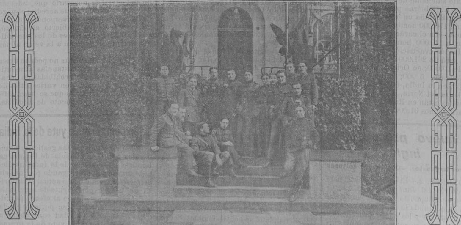
LA 11.ª ESCUADRILLA DE AVIADORES BELGAS EN DOCKUM (ALEMANIA)

COPENHAGUE, 3.—Un telegrama de Berlín al periódico National Tidende dice que los bolcheviks avanzan hacia la frontera alemana. Gran número de espías y agentes secretos rusos despliegan gran actividad. El Estado Mayor del ejército rojo está dando los últimos toques al plan de campaña contra Alemania cuando empiece el buen tiempo, y dispone de un ejército de 150.000 hombres.