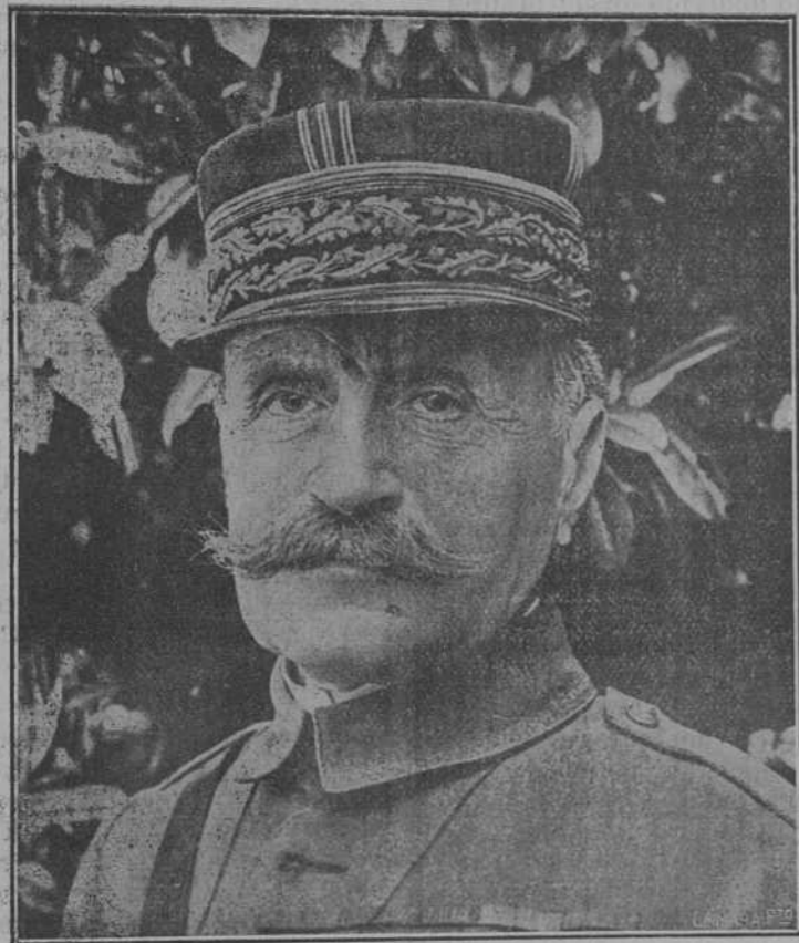
EL GENERALÍSIMO DEL EJÉRCITO FRANCÉS, FOCH

Aquellos sueños de asomarse al Canal de la Mancha, de apoderarse de Calais y Dunkerque, de conquistar París, se desvanecieron. El Alto Mando alemán no pudo conservar la integridad de sus líneas; la guerra de trincheras, que había sido un expediente cómodo, empezó a resultar contraproducente; las alambrias eléctricas, los fosos y contrafosos, los artillugos de topo fracasaron ruidosamente ante el empuje tan maravilloso como fantástico de los tanques