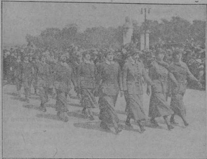
ENFERMERAS DE HOSPITALES MILITARES

Desde los tiempos anteriores á la guerra, en que el feminismo militante se agitaba por cooperar en la gobernanación pública con los varones, reclamando derechos políticos é interviniendo en las diversas funciones de la administración, hasta ahora, en que la hermosa compañera del hombre reclama su puesto de auxiliar eficazísimo, ya en los talleres y en las fábricas, ya en los servicios municipales, ó en las enfermerías y ambulancias, ora para suplir la falta de iniciativas y de brazos, ora para organizar los trabajos en que el soldado combatiente ha de abandonar para acudir al puesto de honor y de peligro, media un verdadero abismo.