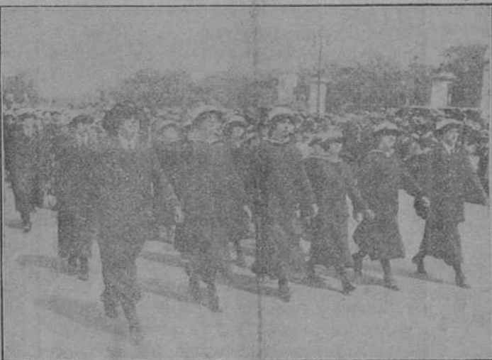
AUXILIARES DE LOS SERVICIOS DE MARINA

La guerra, pues, utilizando en todos sentidos y en las diversas orientaciones la aptitud especial de los auxiliares femeninos ha logrado éxitos notables; y desde luego hay que señalar que aquellas antiguas manifestaciones del sufragismo, tan ridículas á veces, tan contra-productivas otras y que en multitud de ocasiones determinaban graves preocupaciones para los gobiernos ó eran ocasión de motines y de disturbios locales y regionales, se han encauzado en forma á resultar de gran importancia y verdadera trascendencia para suplir á los hombres en los diversos servicios, muchos de ellos rudos y desagradables, que estas nobles mujeres desempeñan con «bnegación», con entusiasmo y con fe, guiadas por el santo amor á la patria.